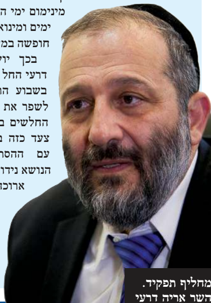
מחליף תפקיד. השר אריה דרעי

בכך יושלם מהלך שהשר דרעי החל בו כבר במאי 2015, בשבוע הראשון שלו במשרד לשפר את מצבם של העובדים החלשים במשק, אולם לעשות צעד כזה בהידברות ובהסכמה עם ההסתדרות והמעסיקים. הנושא נידון בין הצדדים תקופה ארוכה והיום מגיע לסיומו. בימים הקרובים בכוונתו של שר הכלכלה דרעי להרחיב את ההסכם לכלל המשק.