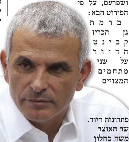
פתרונות דיור. שר האוצר משה כחלון

קבינט הדיור אישר ביום חמישי האחרון את הצעת שר האוצר, ח"כ משה כחלון, להכרזת 7 מתחמים מועדפים לדיור בישובים: רמת גן, קרית אתא, באר יעקב, קצרין, אופקים ושפרעם, על פי הפירוט הבא: