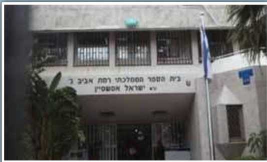
בית"ס ברמת אביב

פעילות לימי חול לעמותה כאשר היא אינה בודקת את הטענות שבבסיס הצו, אינה מאפשרת לעמותה לטעון נגדה וכשהצו עומד בסתירה מוחלטת להסכמות והרשאות שניתנו על ידי העירייה עצמה". מעיריית תל אביב-יפו נמסר בתגובה: "בניגוד לנטען, העירייה קיימה פגישת הידברות עם נציגי בית הכנסת, במסגרתה הוסבר להם כי על פי הנחיות משרד החינוך, מטעמים ברורים, אין לאפשר גישה למבוגרים לשטח בית הספר בשעות הלימודים, אשר חופפות לשעות התפילה, על מנת לא ליצור מגע של המתפללים עם קטינים הלומדים במקום. זאת, לאחר שהתקבלו תלונות הורים על הטרדת התלמידים על ידי המתפללים. יודגש כי האיסור הוא לימי חול בלבד, כאשר בימים שישי ושבת מורשים הבאים להתפלל במקום. יצוין כי בימים אלה נכנה ברמת אביב ג' בית כנסת שמיועד לשרת את ציבור המתפללים, על קרקע שהקצתה לכך העירייה".