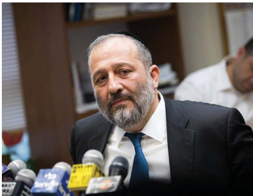
דרעי במסיבת עיתונאים השבוע

המבחן הגדול ליכולתו של דרעי: אחרי למעלה משני עשורים, מקבל יו"ר ש"ס לידיו משרד ממשלתי עם תקציבי חלוקה לא צבועים שמזכיר את משרד הפנים בשנות השמונים • בלשכת שר הפריפריה, הנגב והגליל חוששים כי שלטון הפקידים והיועצים המשפטיים יקשה עליהם להתנהל מול הרשויות • בינתיים, מגמת הטרפוד המשפטי ניכרת בכל החזיתות: המשנה ליועמ"ש אבי ליכט הבהיר לפרוש ולגפני: "מה שמגיע לכם תקבלו גם בלי הסכמים", אך בפועל גם ההכנות שסוכמו בסוגיית הגיוס והתקציבים, מטורפות על ידי היועצים המשפטיים ופקידי האוצר • אחרי פרשת קצבאות החיסכון, שר הבריאות ליצמן שב ומבטיח לעמוד על קוצו של יו"ד בקיום ההסכמים הקואליציוניים / בית ספר לפוליטיקה