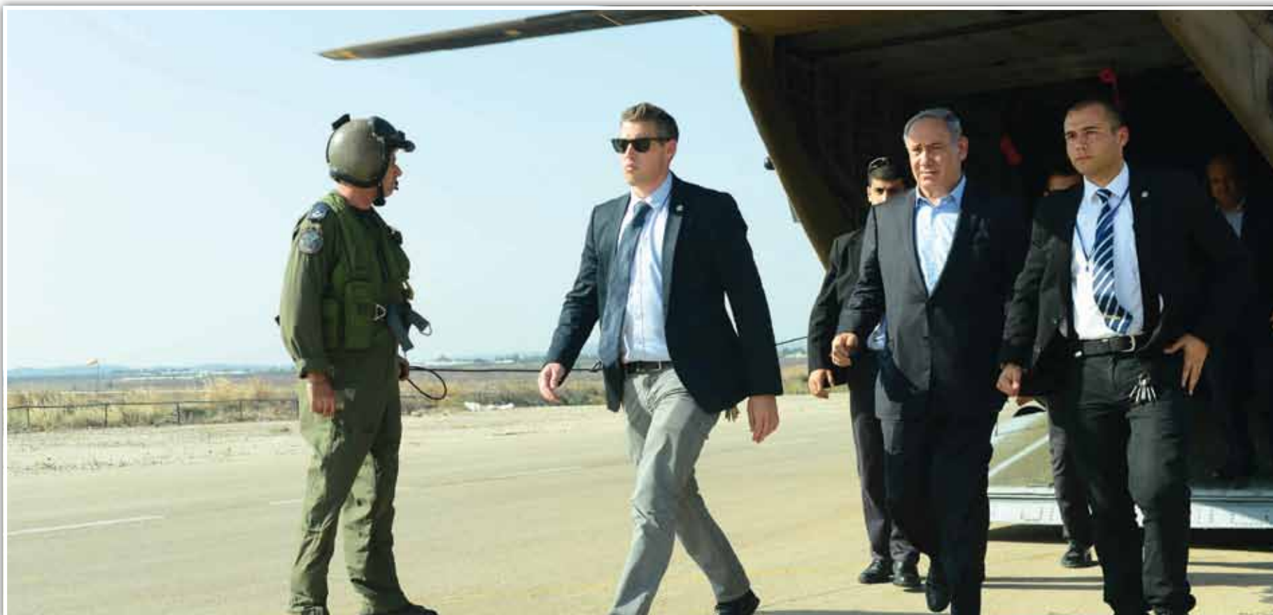
נתניהו בסיוור בצפון יורד ממסוק ראש הממשלה, ביום שלישי השבוע