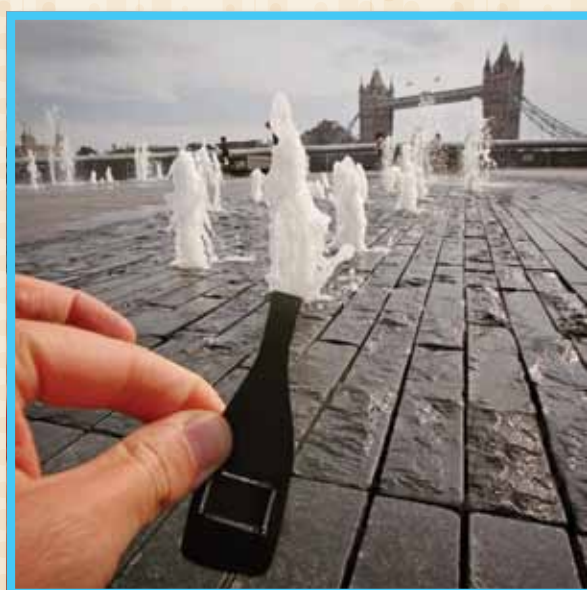
ליד גשר לונדון