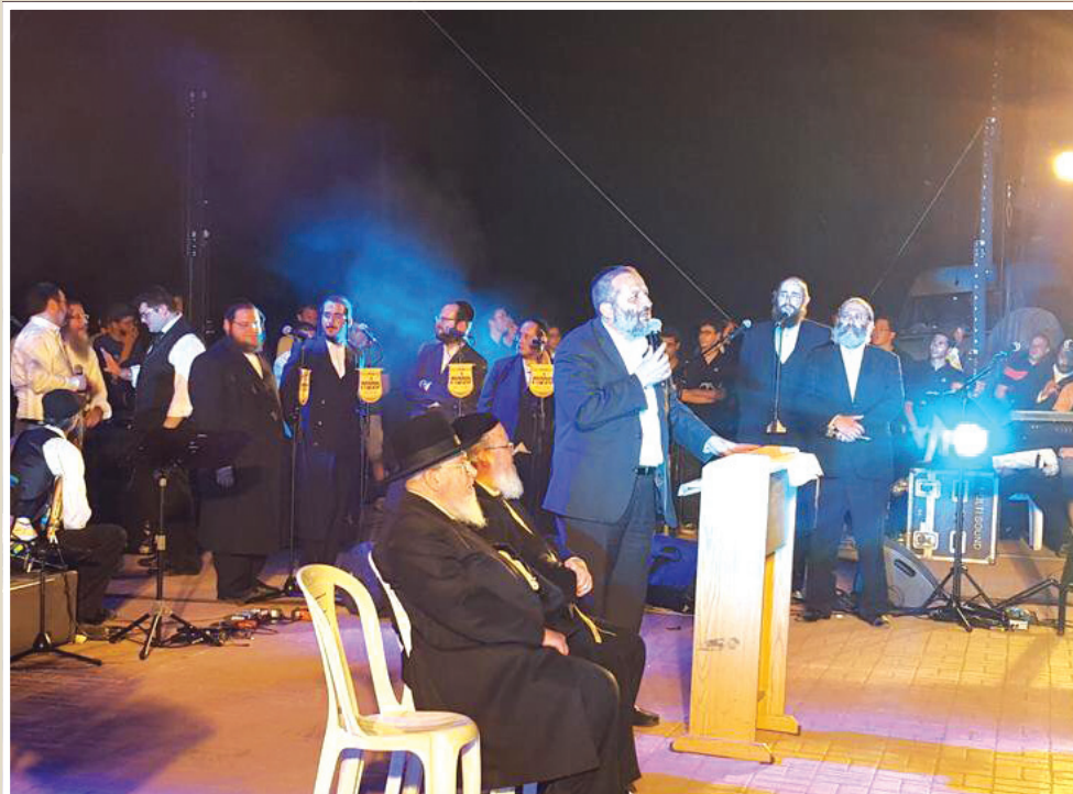
"כשאנחנו מדברים על יהודי, אתה גורם לעוד יהודי להידקף". הגר"י זילברשטיין בשיעור, שר הכלכלה אריה דרעי במחנה 'בני תורה', שר הביטחון בוגי יעלון