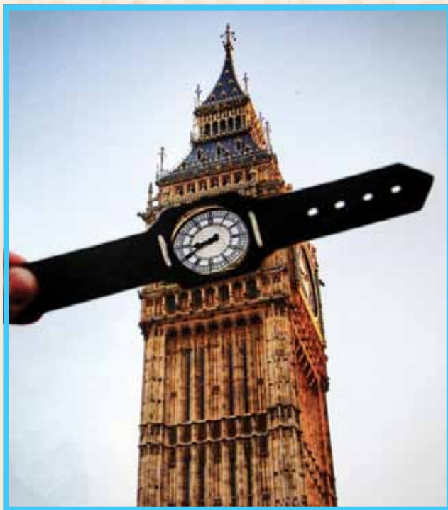
שעון הביג-בן בלונדון

הסתכלו נא בתמונות המרכיבות את הכתבה, ותנסו להבין: מה הוסיף מקור לתמונה? כיצד אתר התיירות נראה עכשיו אחרת? אם תסתכלו היטב, תראו שמקור הוא אכן מאד מקורי.