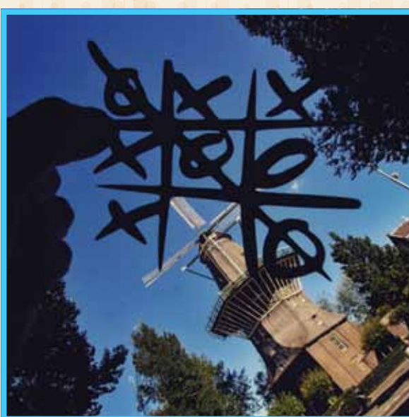
טחנת רוח בהולנד