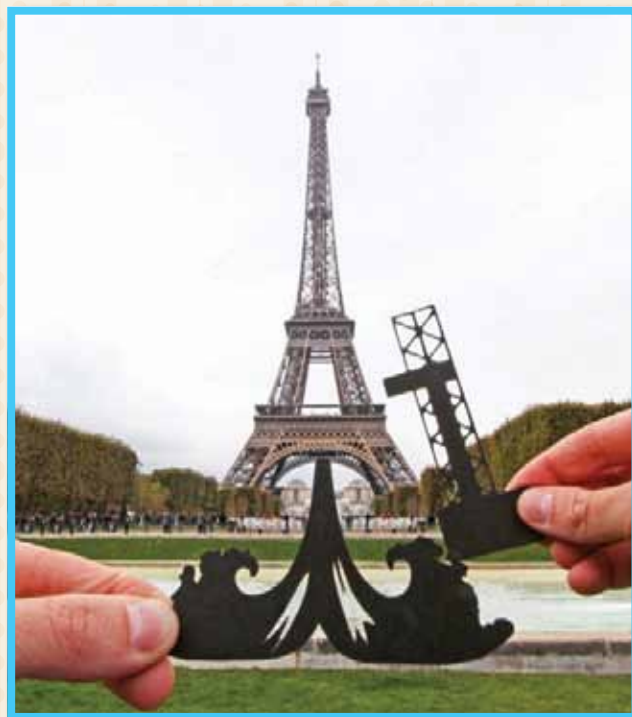
מגדל אייפל בפריז