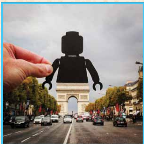
שער הניצחון בפריז