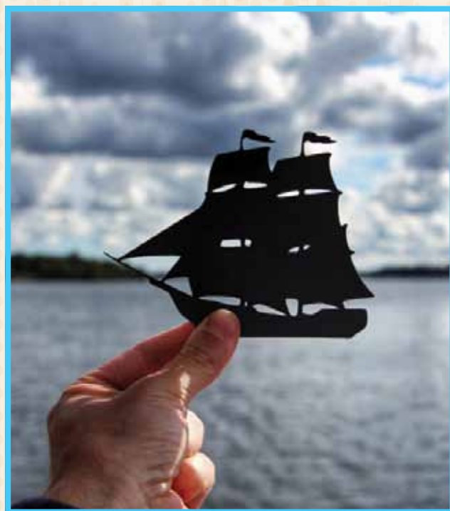
על רקע של ימה של אמסטרדם