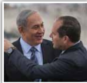
נכבד לא חברים. נתניהו וברקת

המכתב ששלח השבוע ראש העיר הירושלמי לראש הממשלה, היה רחוק מנופת צופים ופוליטיקלי-קורקט. "קצנו בדיבורים ובהצהרות פומביות על חשיבותה של ירושלים ומעמדה, הגיעה שעת המעשים", כתב ברכת לנתניהו במכתב זועם ששוגר במקביל לכל כלי התקשורת בישראל