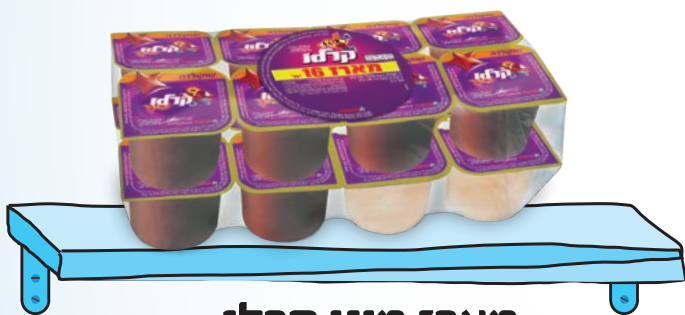
מארז מיני קרלו 100 גר' 16x יח'