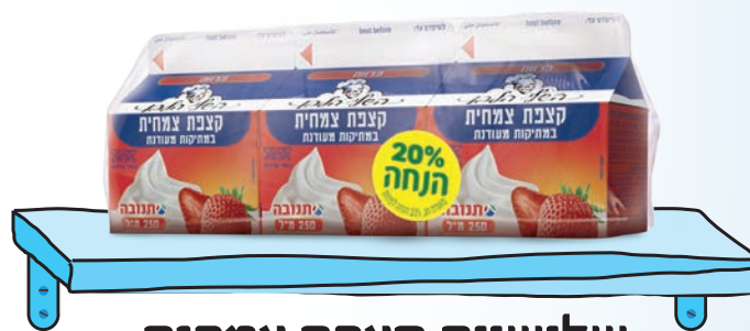
שלישיית קצפת צמחית 250 מ"ל 3x יח'