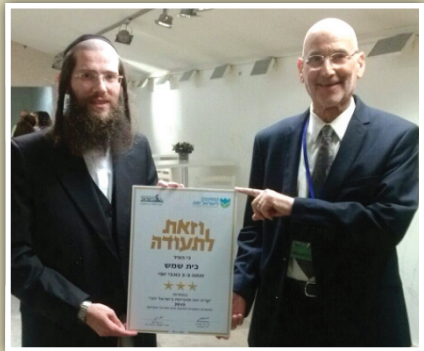
מאת: אלי שניידר

לאחר מספר שנים שהעיר בית שמש לא משתתפת בתחרות 'כוכבי היופי' של המשרד להגנת הסביבה, השבוע היא זכתה בכוכבים הנכספים