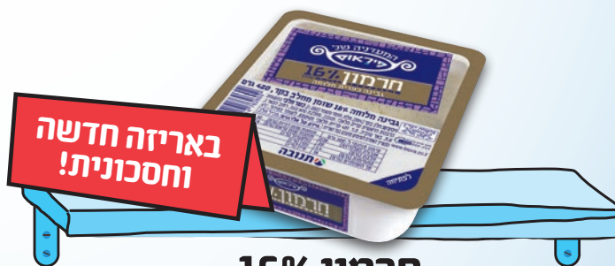
חרמון 16% מסדרת המעדנייה של פיראוס | 420 גר'