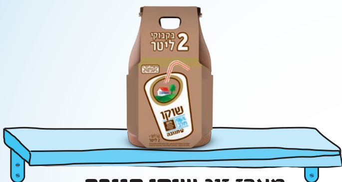
מארז זוג שוקו תנובה 1 ליטר 2x יח'