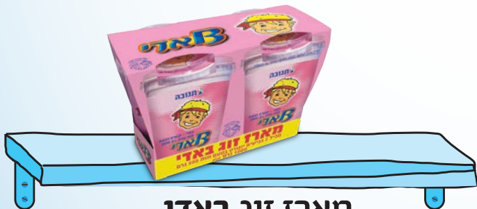
מארז זוג באדי 500 גר' 2x יח'