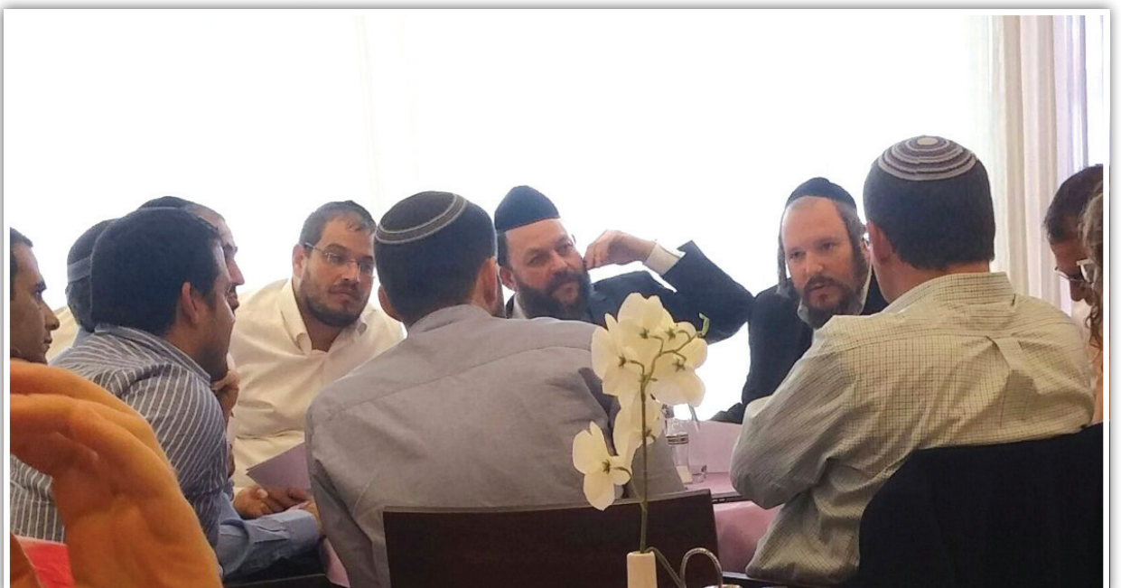
"אם קוראים לי אני בא". מפגש הקצוות במזנון הח"כים. נראים מימין לשמאל: רובינשטיין, גוטמן וליטוב. מולם במרכז: ח"כ סמוטריץ'

גפני חשף את השיטה, וגילה כיצד נתפרים מאות מיליונים ליעדים סרוגים - כולל גרעינים תורניים שהתיישבו במרכז