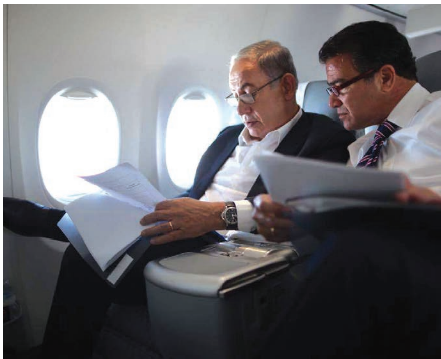
ראש הממשלה בנימין נתניהו וראש המוסד יוסי כהן