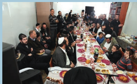
ההתוועדות החסידי המיוחדת ברמה ג'