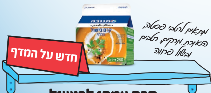
קרם צמחי לבישול 250 מ"ל