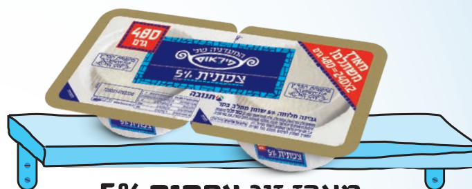
מארז זוג צפתית 5% מסדרת המעדנייה של פיראוס | 240 גר' 2x יח'