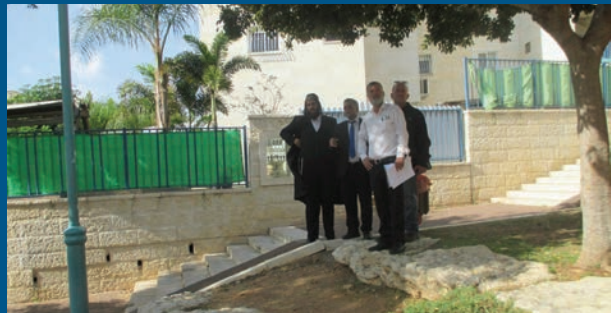
בסיוור בגינות העיר

בעירייה מסבירים כי התהליך בוצע על מנת לאפשר למוסדות להיערך מוקדם, ולקבל את האישורים עוד לפני תחילת שנת הלימודים. צעד שיסייע להם באופן משמעותי לניהול המוסדות. בעירייה קראו למנהלי המוסדות להקדים ולהגיש את המסמכים הנדרשים, על מנת לייעל ולאפשר את זירוז התהליך. כמו כן, נערך בימים אלה מיפוי צרכים מלא של כלל המוסדות, גם זאת כחלק מההיערכות המוקדמת. העירייה גם מוציאה בימים אלה מכרזים מוקדמים להליכי הביצוע של פתיחת שנת הלימודים.