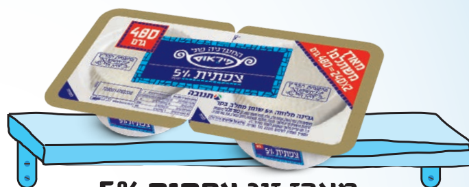
מארז זוג צפתית 5% מסדרת המעדנייה של פיראוס | 240 גר' 2x יח'