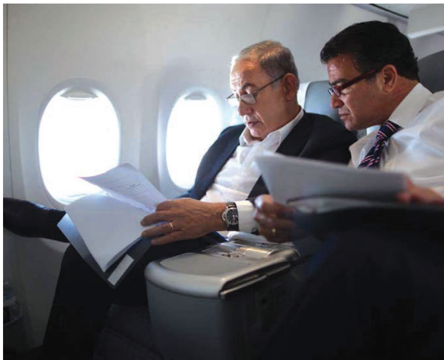
ראש הממשלה בנימין נתניהו וראש המוסד יוסי כהן