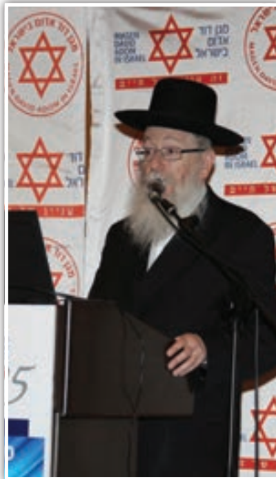
שר הבריאות יעקב ליצמן בכנס רפואת חירום של מד"א

בכנס מד"א בנושאי החייאה ורפואת חירום, שהתקיים הבוקר (28.12.2015) במלון הילטון בתל אביב, פנה שר הבריאות, הרב יעקב ליצמן לנוכחים ואמר: "אנחנו עדים יום יום איך אנשי מד"א מקריבים את עצמם כדי להציל אנשים".