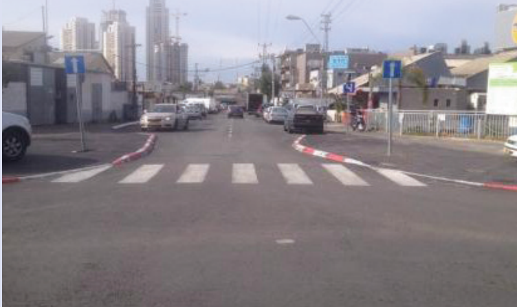
רחוב יקואל

רחוב יקואל באזור העסקים הפך לחד סטרי במסגרת הסדרת תנועה באזור העסקים המתחדש "פארק הים"