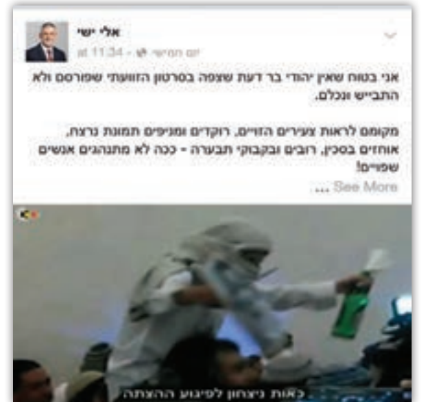
גינזי-גיבוי. פרסומי ישי ברשת החברתית