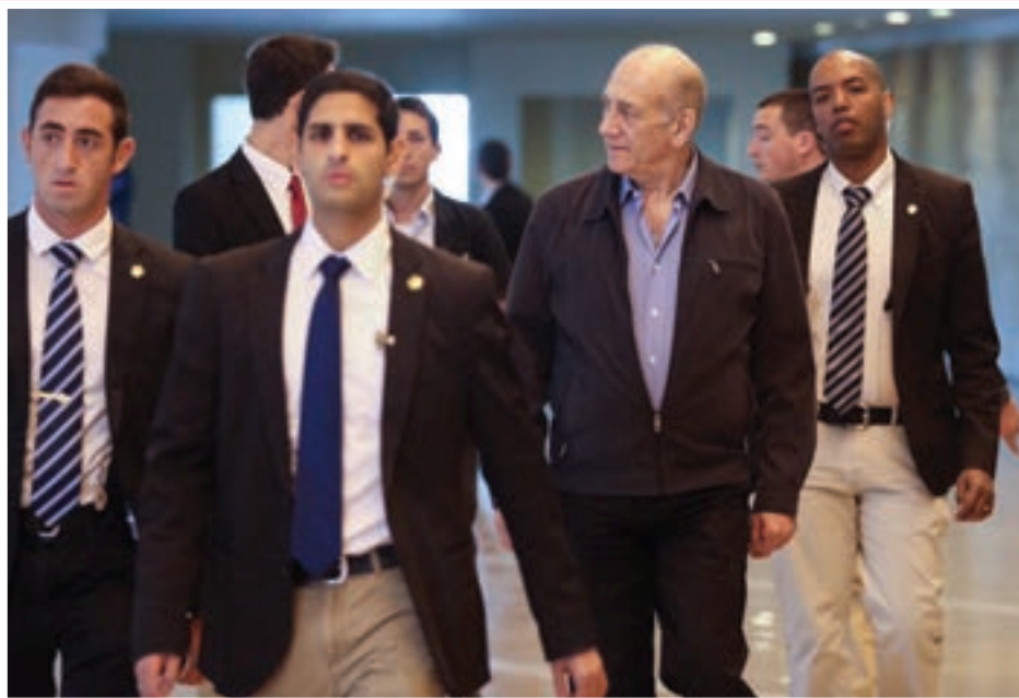
אולמרט ביציאה מבית המשפט

ביום שלישי בבוקר הכריע בית המשפט העליון בערעורם של מורשעי פרשת 'הולילנד' • ההחלטות הדרמטיות: גזר דינו של אולמרט הופחת: שנה וחצי מאסר בפועל • גזר דינו של לופוליאנסקי: 6 חודשי עבודות שירות בלבד