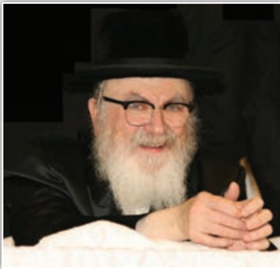
כ"ק האדמו"ר מסקווירא שליט"א