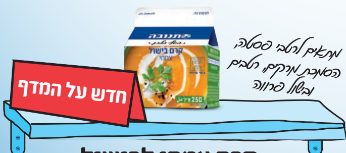
קרם צמחי לבישול 250 מ"ל