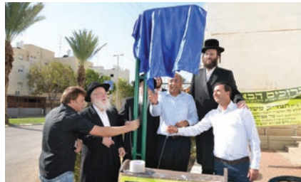
בטקס חניכת רחוב הצדיק משטפנשט