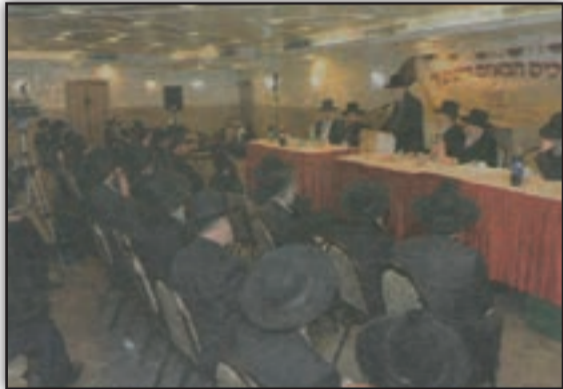
המעמד השבוע ברחובות

מרן ראש הישיבה הגר"א שליט"א: "אפילו אנשים שמרגישים שהם נקיים בזה, עלולים ברגע אחד ליפול חלילה" ● מרן שר התורה הגר"ח קניבסקי שליט"א: "אין שום היתר בעולם להשתמש בזה ולא בחלק ממנו" ● הגאון הגדול רבי שלום כהן שליט"א: "אדם שיש לו את המכשיל הזה בכיסו כולו חטא מהראש למעלה עד הסוף" ● הגאון הגדול רבי שמעון בעדני שליט"א: "טוב עשו רבני ישראל בכל עיר להתכנס ולעמוד על נפש עמך בית ישראל" ● כ"ק האדמו"ר מויז'ניץ שליט"א: "אסור שיהיו בענין זה פשרות" ● כ"ק האדמו"ר מצאנז שליט"א: "היצה"ר מנסה בכל כוחו להפיל את האדם לתוך מכמתו"