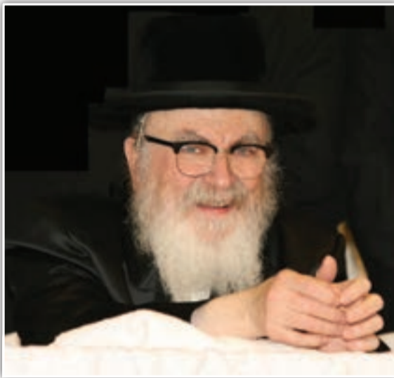
כ"ק האדמו"ר מסקווירא שליט"א