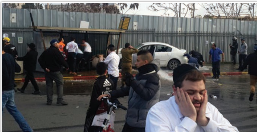
האם תחנה ממוגנת תעזור? פיגוע הדריסה השבוע

14 פצועים בפיגוע דריסה בגשר המיתרים בכניסה לירושלים ביום שני • בין הפצועים גם חרדים, ותינוק בן שנה וחצי - שאיבד את רגלו • בריאותו ברכבו של המחבל נמצא גרזן • בעקבות הפיגוע: ברקת הורה למגן מאות תחנות אוטובוס בירושלים