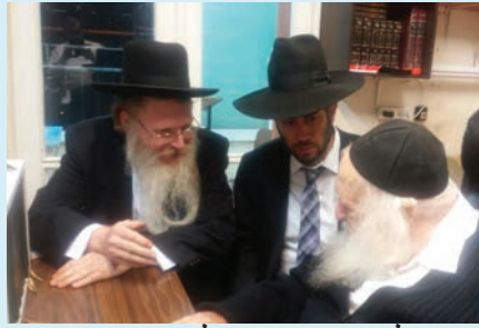
הרב קלרמן והרב רוטשילד מתברכים ממרן הגר"ח קניבסקי שליט"א

שיתוף פעולה בין וועדי הגנטורים לבין אגפי העירייה בכדי להכשיר חוקית את הגנטורים בעיר • מרן הגר"ח קניבסקי לישראל קלרמן: "חובה להישמע לרשויות ולפעול בכל האפשרויות שהגנטורים יהיו מונחים בהסכמה ובאופן חוקי ולא יגרמו לסכנה ח"ו"