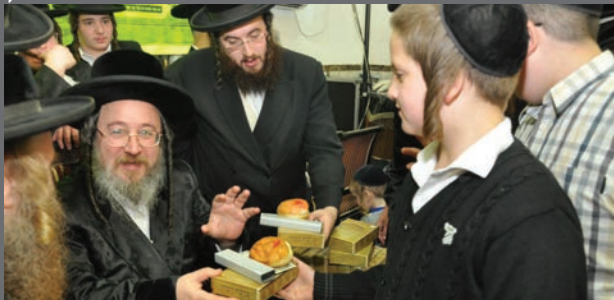
חלק מהילדים אצל כ"ק האדמו"ר מביאלא

למעלה ממאה ילדים יתומים השתתפו במעמד תפילה במחיצתו של האדמו"ר מביאלא בני ברק