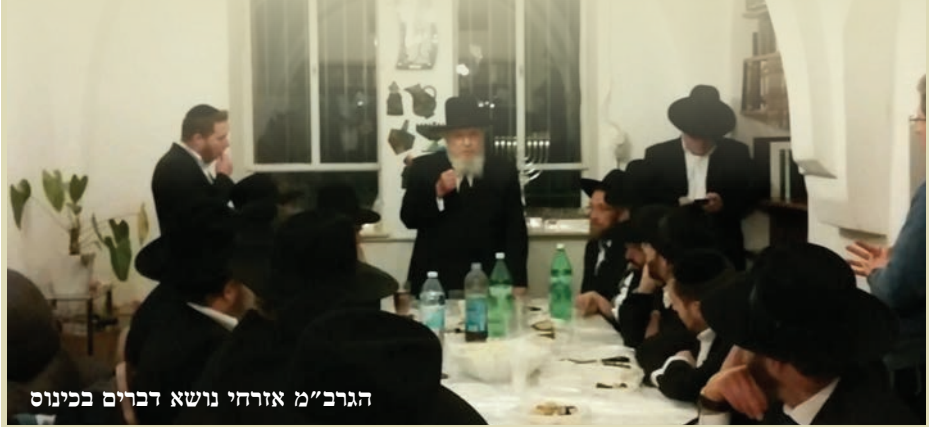
הגר"מ אזרחי נושא דברים בכינוס

כך אמר הגר"ח נבנצאל בכינוס פעילי דגל התורה בירושלים, כאשר דיבר על חשיבות העמידה בפרץ נגד אירועים המחללים את ירושלים • כיבד בהשתתפותו: הגאון הגדול הגר"מ אזרחי שליט"א