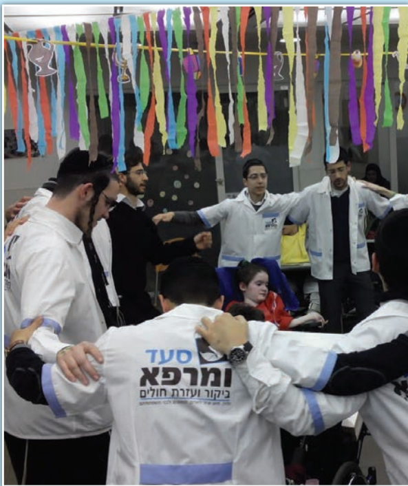
מתנדבי סעד ומרפא

צוות המתנדבים של "סעד ומרפא", שבחודש האחרון קיבל את אות המופת מנשיא המדינה, קיים שורה של אירועים, מסיבות חנוכה ונופשון לילדים חולים ומשפחות מעוטות יכולת