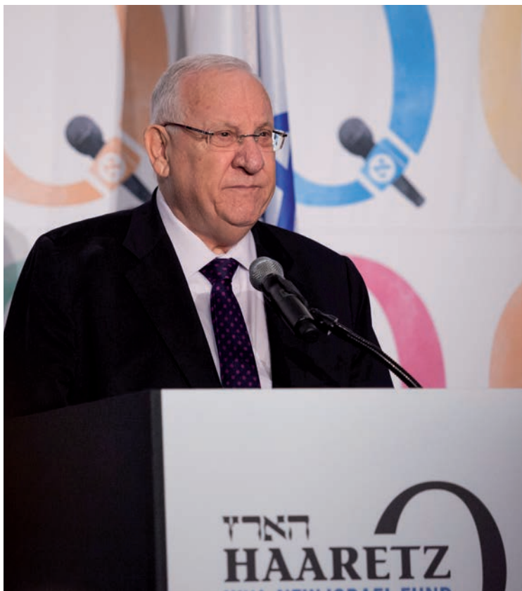
ריבלין בוועידת 'הארץ' השבוע