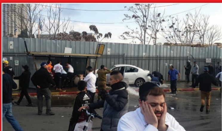
האם תחנה ממוגנת תעזור? פיגוע הדריסה השבוע

14 פצועים בפיגוע דריסה בגשר המיתרים בכניסה לירושלים ביום שני • בין הפצועים גם חרדים, ותינוק בן שנה וחצי - שאיבד את רגלו • בריאותו ברכבו של המחבל נמצא גרזן • בעקבות הפיגוע: ברקת הורה למגן מאות תחנות אוטובוס בירושלים / עמ' 4