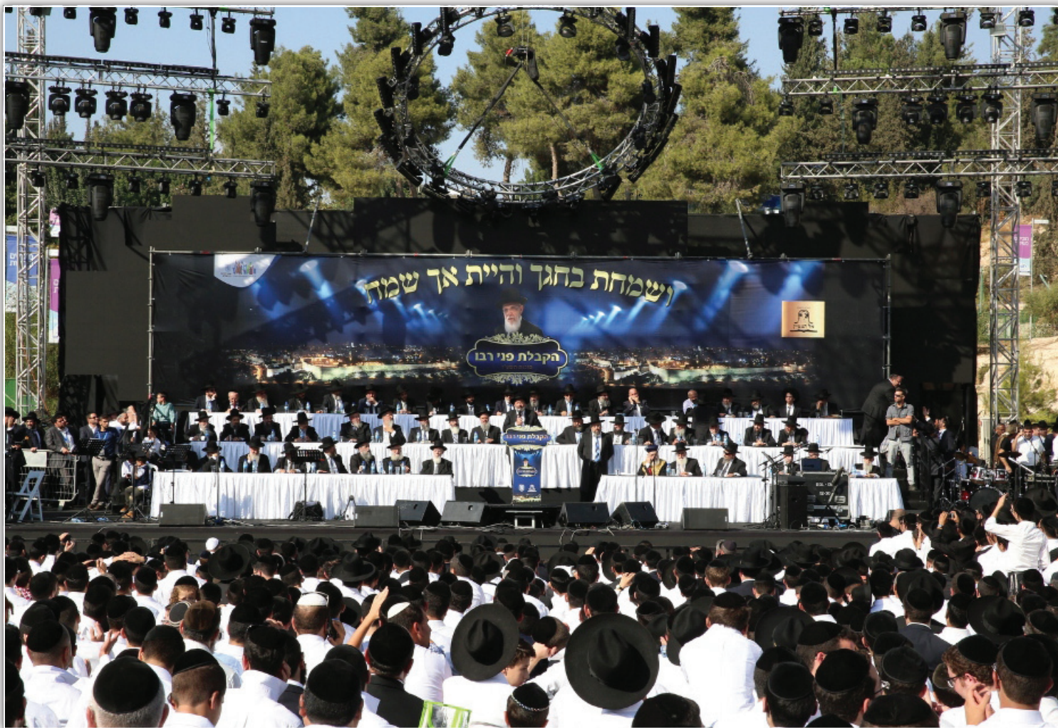
מכיכר רבין לברית הסולטן. מעמד הקבלת פני רבו של אל המעיין בירושלים