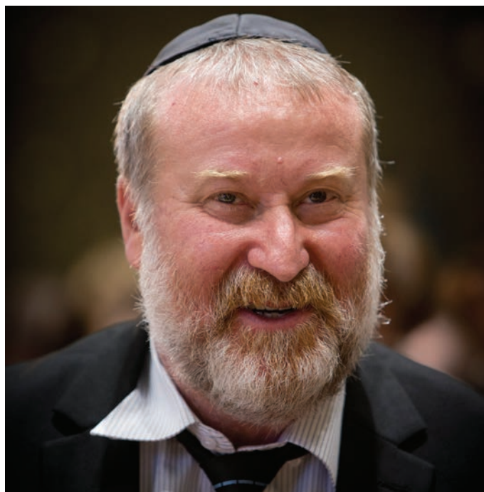
מתערכ בנשוא. מנדלבליט

לראשונה מאז קום המדינה - כפייה אנטי חרדית עם גושפנקא משפטית: חוות דעת ששלחה המשנה ליועמ"ש עו"ד דינה זילבר אוסרת על קיום אירועים בהפרדה • חוות הדעת הובילה לרצף אירועים בהפרדה שבוטלו בשל טענה על 'הדרת נשים' • בירושלים, דחו ברגע האחרון שופטי ביהמ"ש המנהלי ובג"ץ את דרישת עו"ד חביליו לאסור על קיום מעמד 'הקבלת פני רבו' • היועמ"ש הבטיח: יתקיים דיון מיוחד בסוגיה בלשכתו במהלכו ייקבעו הנחיות ברורות / אבי בלום, בי"ס לפוליטיקה