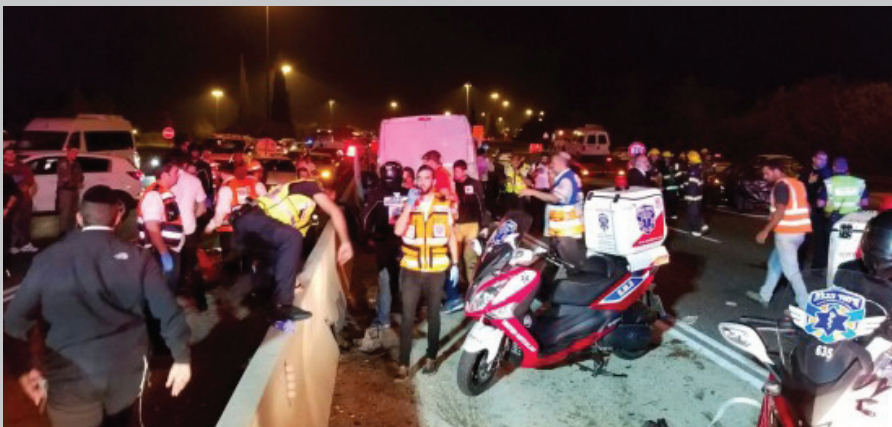
זירת התאונה בכביש 1