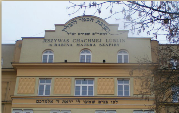
ישיבת חכמי לובלין

פרק אחר בכנס, שעמד תחת הכותרת "באו בה פריצים וחיללוה", יוחד לכרסום המדאיג במעמדו ובכבודו של מבנה ישיבת חכמי