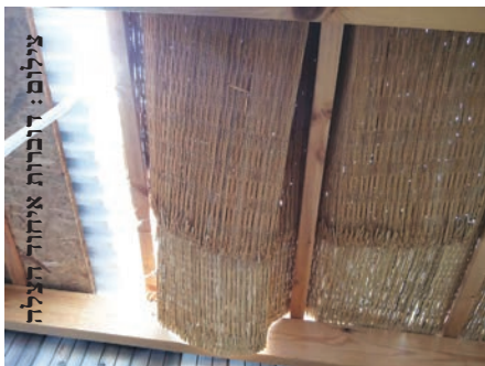
הסכך שריכך את הנפילה

שני ילדים תושבי אלעד שנפלו במהלך ימי ערב החג מגובה - ניצלו ברגע האחרון לאחר שנבלמו בסכך הסוכות