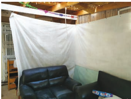
הספה אליה נפל אחד הילדים