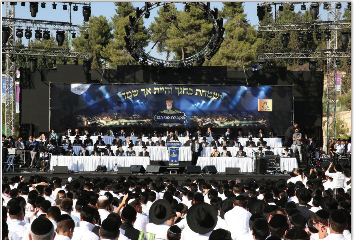
מכיכר רבין לברית הסולטן. מעמד הקבלת פני רבו של אל המעיין בירושלים