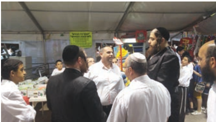
ראש העיר בשוק ארבעת המינים

הדוכנים למכירה במשרדי המתנ"ס, הוחלט על הרחבת השוק, כאשר בתהליך מזורז הוכשר שטח סמוך ואוהל נוסף הוקם במקום. במהלך ימי ערב החג, פעלה העירייה ויחידת