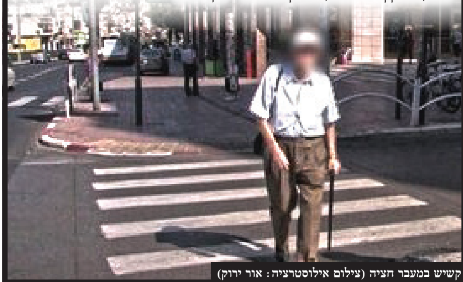
קשיש במעבר חציה