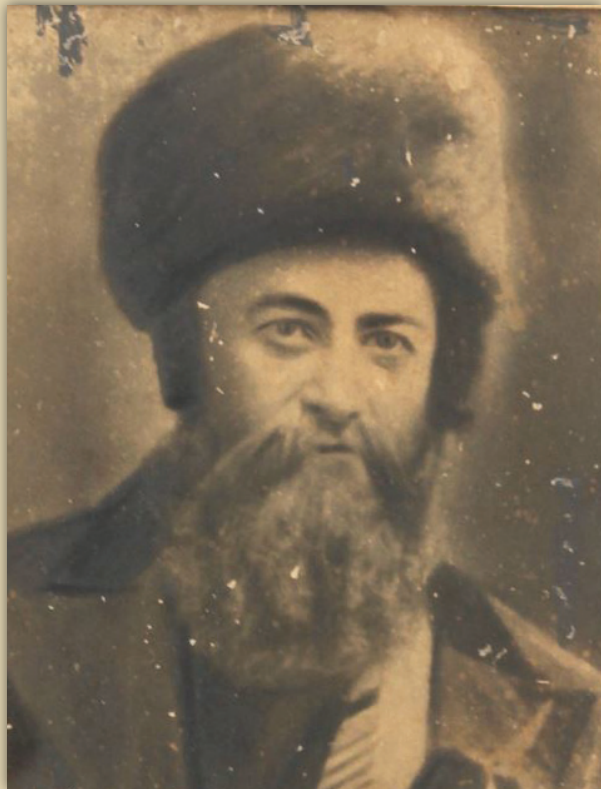
המהר"ם שפירא מלובלין

אורחי ההתכנסות הודיעו מצדם, כי יירתמו לבדוק את הדרכים לסייע למרכז, ולפעולותיו הנשגבות להעמקת לימודי "הדף היומי", ולהאדרת שמו של מחוללו ויוצרו, הרב מלובלין זצוק"ל.