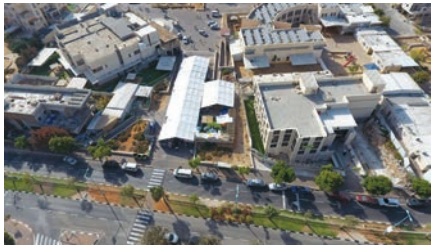
השוק במבט מלמעלה