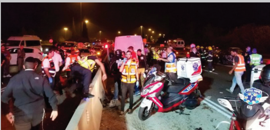
זירת התאונה בכביש 1