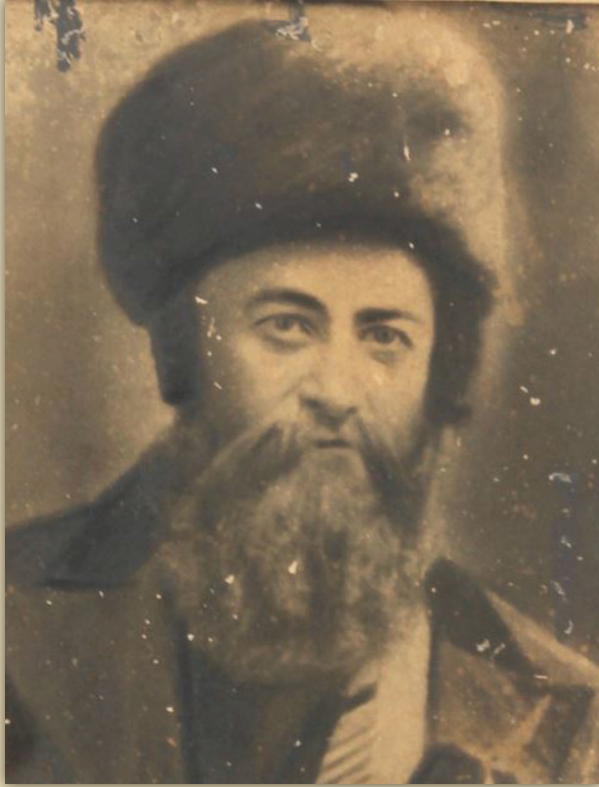
המהר"ם שפירא מלובלין

פרק אחר בכנס, שעמד תחת הכותרת "באו בה פריצים וחיללוה", יוחד לכרסום המדאיג במעמדו ובכבודו של מבנה ישיבת חכמי