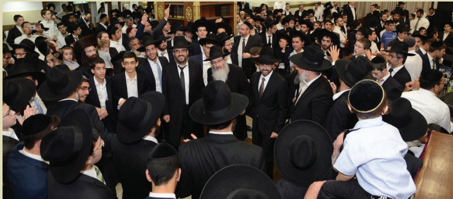
ריקוד שמחה במעמד המיוחד

בהפקה יוצאת מן הכלל התקיים האירוע המכובד, אשר זכה לכותרת ולסלוגן מיוחד 'לכבוד עמלי התורה', ביום חמישי ד' דחיה"מ