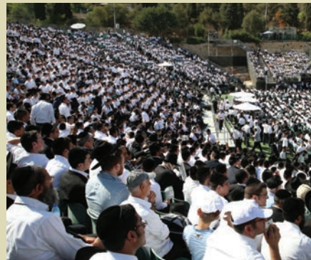
מאת: יעקב אמסלם

בדבריו דיבר השר דרעי על החלטת אונסק"ו המבקשת לעקר את הזיקה היהודית להר הבית ואמר כי "אומות העולם, הלכה היא ש'עשיו שונא ליעקב', החליטו שעם ישראל אין לו קשר לירושלים, אין לו קשר לכותל המערבי. היום, מי שראה את הרבנות בברכת כוהנים (בכותל המערבי), מי שרואה את הרבנות שנמצאים כאן, זו התשובה שלנו לאומות העולם. ירושלים שלנו, מקום המקדש ייבנה במהרה בימינו ומשם הברכה תצא לכל העולם".