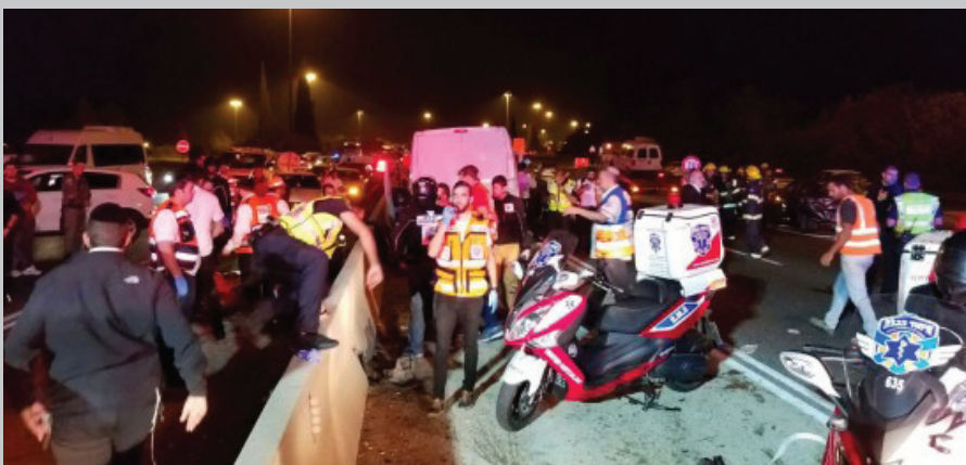
זירת התאונה בכביש 1