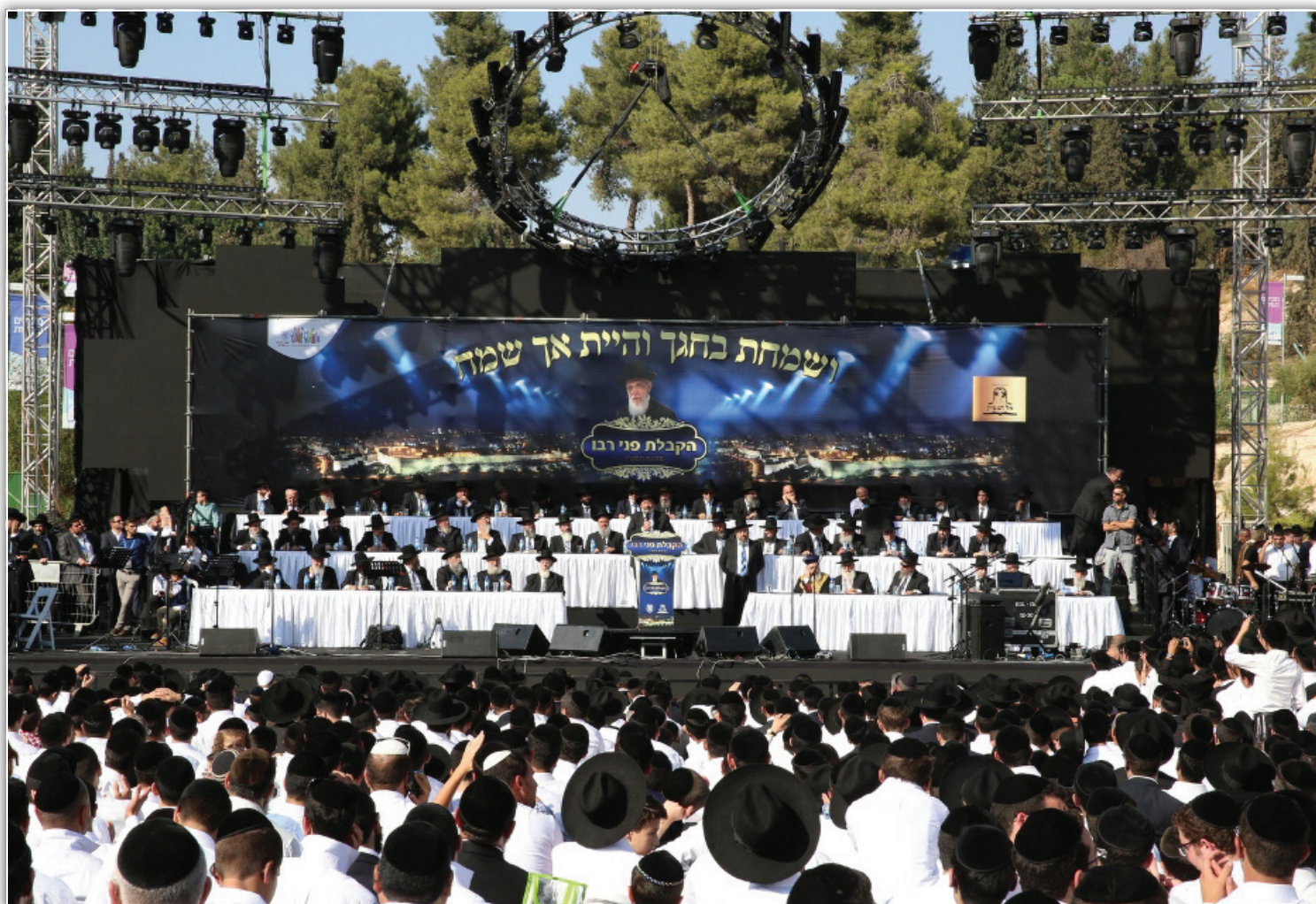
מכיכר רבין לברית הסולטן. מעמד הקבלת פני רבו של אל המעיין בירושלים

עם כל הכבוד, ויש בכמויות, ליועץ המשפטי חובש כיפת הבד השחורה - אין די בביקורת העקיפה והמרומזת שמתח על סגניתו. דינה זילבר קובעת אמות מידה שאינן מאפשרות מרחב מחיה לציבור החרדי. חברי כנסת חרדים ששוחחו עם מנדלבליט, הבינו כי בכוונתו לכנס בלשכתו דיון מיוחד, מיד אחרי החגים. דא עקא - כפי שמתנסחים - המשפטנים - שהמונח 'אחרי החגים', הוא מכבסת מילים ידועה, לרעה