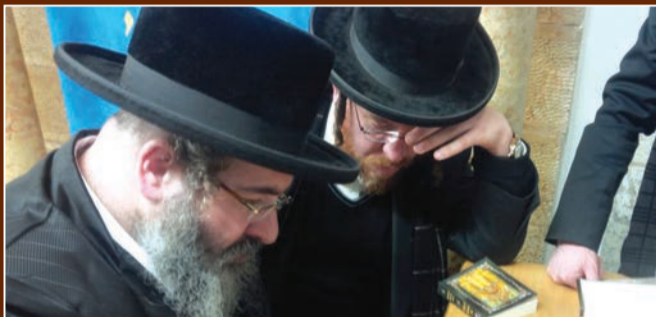
המגיד שיעור ממיר בציון שמואל הנביא