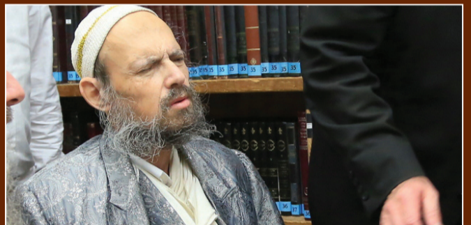
הגר"ד קוק בביקור בבית מדרש הגר"ח קנייבסקי

הגר"ש כתב במכתבו: "הנני בזה להעיר ולהאיר ולמחות נחרצות בכל לשון של מחאה, ובזעקה גדולה ומרה, על דבר הפירצה הנוראה עד למאד, בקדושת הר הבית אשר לב כל ישראל מאז ומתמיד חרד על המקום הנורא הזה, וזכורני את הפחד והבהלה הגדולה שהי' לאאמו"ר גאון ישראל זללה"ה, כאשר התחיל האפשרות וכמה מאחינו התחילו לזלזל ולעלות בהר ד' שמה, וטרח אאמו"ר זללה"ה בכל כוחו ובכל ליבו בכל מיני דרכים והשפעות לפרסם חומר האיסור בעליה להר הבית, והיה מזועזע עד למאד, וכאשר שמעתי ממנו שמאז היה מקובל שאין אנו בקיאים היום בכל טומאה היוצא מגופו וכו', וגם כל הדבר זו פירצה גדולה ונוראה עד למאד, וכבר מיחו על זה בשעתו בכל תוקף ועוז גדולי ומאורי ישראל מרנן בעל הקהילות יעקב ובעל אבי עזרי ומרן הגר"ש זצוק"ל".