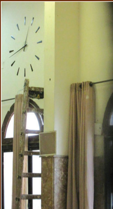
השעון בשיבת פוניבז'