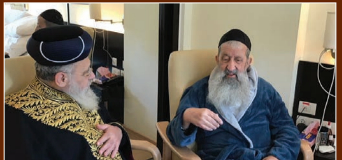
הראש"ל הגר"י יוסף בביקור אצל הגר"צ מוצפי