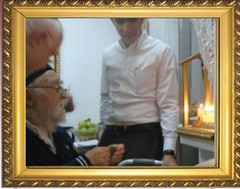
הגר"י מאמן, זקן הכני מחקו, השתחרר מביה"ח