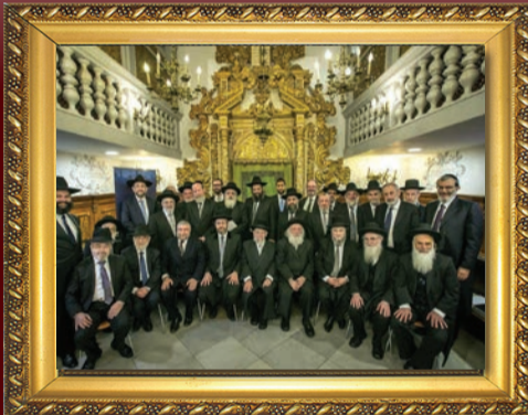
'ועידת רבני אירופה' הציגה בירושלים: בתי דין המאושרים לגירורים