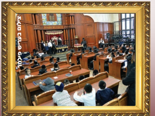
ילדי ת"ת שטפנשט אצל האדמו"ר מסדיגורה