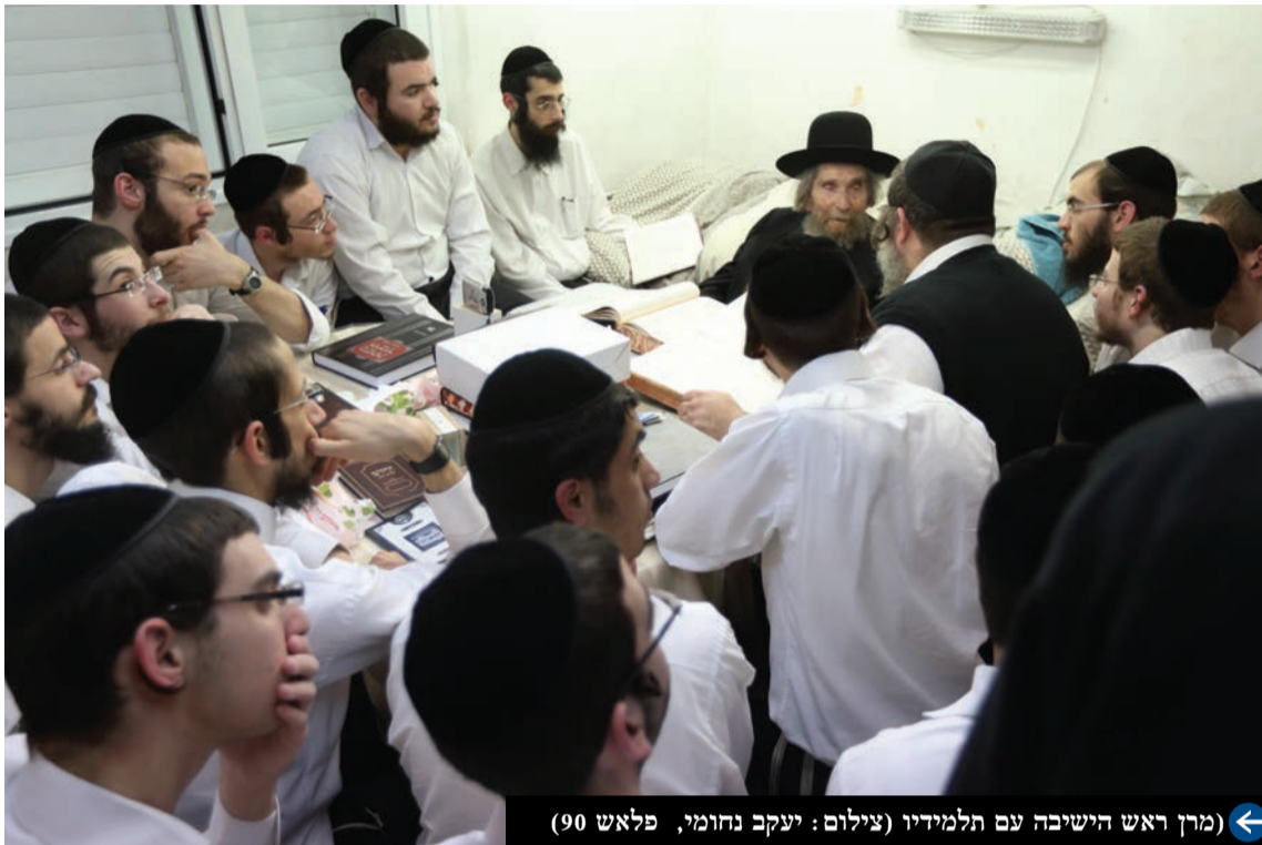
← (מין ראש הישיבה עם תלמידיו