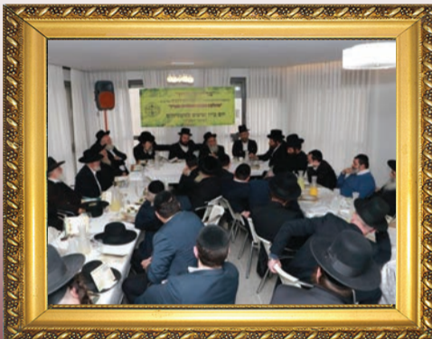
יום עיון למשגיחי המחלקה למצוות התלויות בארץ של מערכת הכשרות 'בד"ץ מהדרין'