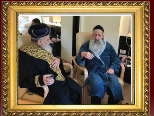
ביקור חולים: הגר"י יוסף אצל הגר"צ מוצפי