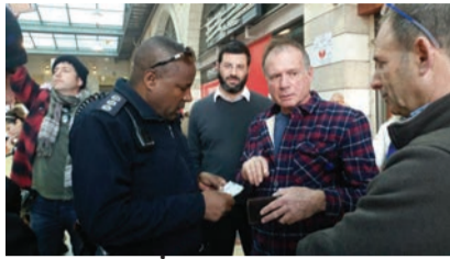
יו"ר מטה המאבק מעוכב לחקירה

קדושים גם מזדעק על כך ש"תושבי העיר אדישים. בונים שכונת ענק בלי שום