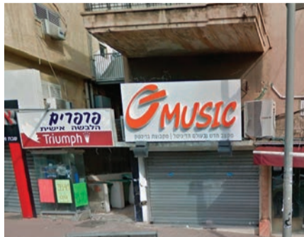
חנות גרינטק.

הכול קורה ברשת, שירים מתפרסמים שם, ואנשים מאזינים למוזיקה דרך ערוצי סטרימינג שונים, הוא אומר לביזנס.