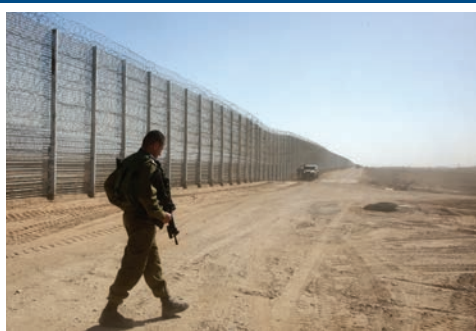
גדר ההפרדה.

על רקע הודעת טראמפ על מימוש אחת מהבטחות הבחירות המרכזיות שלו, זינקו מניותיה של חברת 'מגל מערכות' הישראלית שהשתתפה בבניית החומה על גבול עזה • בקהילה היהודית במקסיקו זועמים