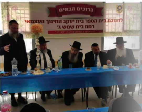
חנוכה ב"ס ברמב"ש ג