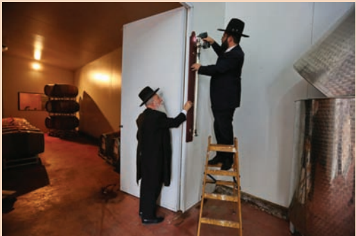
קובעים את מזוזה הענק.

קביעת מזוזה ענק, סיום מסכת והכתרת רב קהילה: באירוע מיוחד נקבעה מזוזה ענק ביקב "כרמא", בגודל 98 סנטימטר ובית המזוזה 1.25 מטר. לאחר קביעת המזוזה סיימו אברכי כולל פנמה, בראשות הגאון הרב ינון רביב את מסכת כתובות ונפרדו מחברם הרב נריה שירה שמונה לכהן כרב קהילת "מאורות הגבעה" ביישוב גבעת זאב.