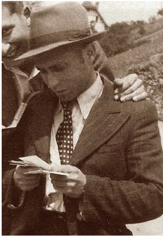
מרן הגראי"ל זצ"ל בבחרותו

ובפעם אחרת נשאל הגר"נ קרליץ – מדוע נכנע בכזו הכנעה נדירה למרן, וכל מה שמורה הרי הוא מציית ומורה כן ללא עוררין? השיב: "אני בעיני ראיתי כיצד מרן ה'חזון איש' קם לכבודו של רבי אהרן ליב כשהיה בגיל פחות מבן ארבעים". מנהג היה נוהג מרן ה"חזון איש" ללוות לפתח הבית את מי שהיה ברצונו לכבד ולהראות אותות חיבה כלפיו. אצל מרן ה'חזון איש' שכל מעשה היה שקול ומדוד אצלו היה נוהג ללוות עד לפתח הבית, רק אנשים מכובדים ביותר, בסדר גודל של גדולי הדור. אולם, בשונה היה הנוהג אצל מרן זצ"ל שעל אף היותו צעיר בשנים היה מרן החזון"א נוהג כלפיו בכבוד השמור לגדולי הדור. בשלב מסוים נמנע מרן זצ"ל מביקורים אצל החזון"א, מקורביו הבינו שהוא מפני הסלידה הנוראה מכבוד, שנחל ממרן החזון"א זצ"ל. (דברים דומים נשמעו לאחרונה מפי מרן הגאון רבי חיים קנייבסקי: "אני בעיני ראיתי