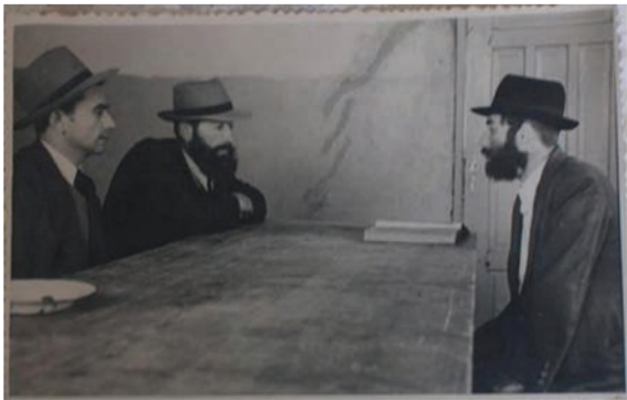
מרן זצ"ל בישיבת צוות בישיבת כפר סבא

שיטתו הייתה כי דרך ההתמודדות של הציבור החרדי עם מוסדות המדינה הציונית, היא על ידי הקמת מוסדות תורה וקירוב. בהשראתו יוצאים אברכים פעם בשבוע למקומות יישוב בפרופריה ולומדים תורה עם התושבים המקומיים. הוא עודד פעילות החזרה בתשובה, ביישוב ומחוצה לה והופיע בכינוסים לחיזוק הפעילות. בין השאר ככהונתו כנשיא ומכוון דרכו של ארגון "לב לאחים", ומאז שנת תש"ס אף שימש כנשיא ישיבת תורת חיים במוסקבה.