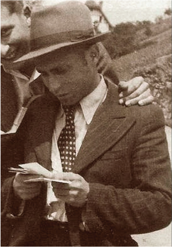
מרן הגראי"ל זצ"ל בבחרותו

מרן זצ"ל עצמו כשהתייחס לעניין באחד משיעוריו אמר: "מהניסיון שלי, אין הרבה השפעה על נפשות צעירים בצעקות