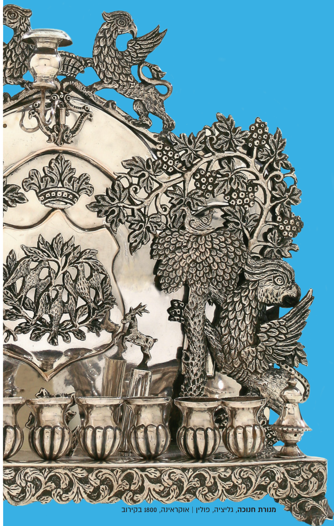
מנורת חנוכה, גליציה, פולין | אוקראינה, 1800 בקירוב

תצוגת חנוכיות מכל תפוצות ישראל שדרת בתי-כנסת עתיקים ירושלים של פרטים - תערוכת צילומים היכל הספר ומגילות מדבר יהודה פעילויות לכל המשפחה