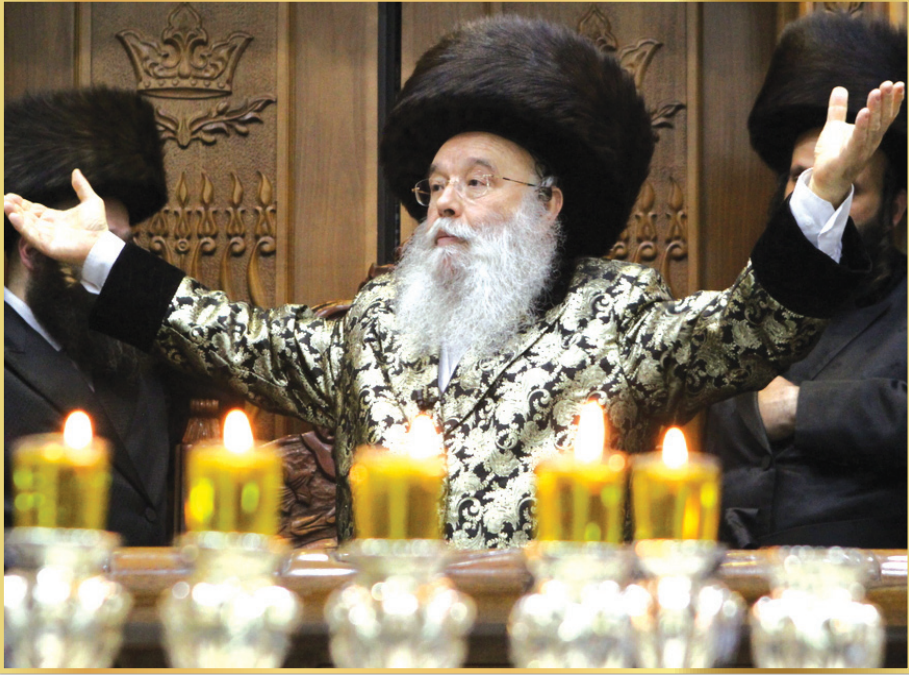
מרן האדמו"ר ממישקולץ שליט"א - מנהיגה הרוחני של פתח תקווה בהדלקה בשנה שעברה

האדמו"ר שליט"א, הקים בעיר פתח תקוה אימפריה אדירה של תורה, חינוך וחסד, שדרכם התחוללה מהפכה רוחנית אדירה בעיר פתח תקוה. בין מוסדותיו המפוארים נמנים, רשת החינוך מישקולץ לגיל הרך, תלמוד תורה, ישיבה לצעירים, ישיבה גדולה, כוללי אברכים, בית דין צדק מישקולץ ומערכת כשרות חזקה ומהודרת לציהה, המעניקה כשרות מהדרין לעשרות גופים, מפעלים ובתי עסק בפתח תקוה ומחוצה לה בהתנרבות מלאה, והיא כיום הכשרות החזקה והפופולארית ביותר בעיר.