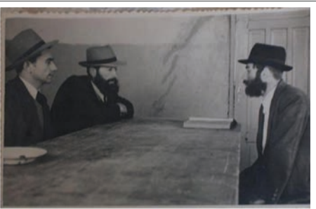
מרן זצ"ל בישיבת צוות בישיבת כפר סבא

החל משנת תשנ"ו הוביל מרן הרב שטיינמן את מפלגת דגל התורה. בשנה זו הכריע על המשך האיחוד בין דגל התורה ואגודת ישראל על פי החלוקה של 40-60 לטובת אגודת ישראל. בשנת תשנ"ט הכריע על כניסה לממשלת אהוד ברק