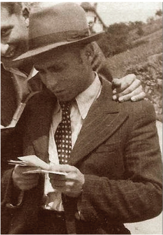
מרן הגראי"ל זצ"ל בבחרותו

ובפעם אחרת נשאל הגר"נ קרליץ – מדוע נכנע בכזו הכנעה נדירה למרן, וכל מה שמורה הרי הוא מציית ומורה כן ללא עוררין? השיב: "אני בעיני ראיתי כיצד מרן ה'חזון איש' קם לכבודו של רבי אהרן ליב כשהיה בגיל פחות מבן ארבעים". מנהג היה נוהג מרן ה"חזון איש" ללוות לפתח הבית את מי שהיה ברצונו לכבד ולהראות אותות חיבה כלפיו. אצל מרן ה'חזון איש' שכל מעשה היה שקול ומדוד אצלו היה נוהג ללוות עד לפתח הבית, רק אנשים מכובדים ביותר, בסדר גודל של גדולי הדור. אולם, בשונה היה הנוהג אצל מרן זצ"ל שעל אף היותו צעיר בשנים היה מרן החזון"א נוהג כלפיו בכבוד השמור לגדולי הדור. בשלב מסוים נמנע מרן זצ"ל מביקורים אצל החזון"א, מקורביו הבינו שהוא מפני הסלידה הנוראה מכבוד, שנחל ממרן החזון"א זצ"ל. (דברים דומים נשמעו לאחרונה מפי מרן הגאון רבי חיים קנייבסקי: "אני בעיני ראיתי