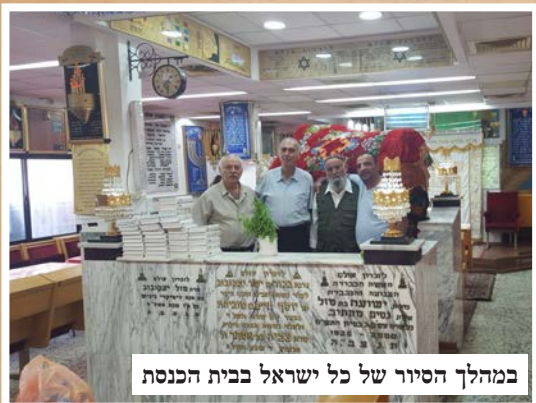
במהלך הסיור של כל ישראל בבית הכנסת