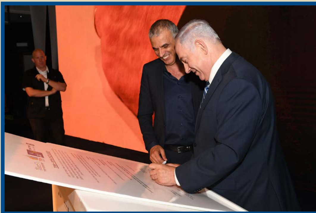
נתניהו וכחלון.

וגם נתניהו, הוא מציג חזות בטוחה שאין כלום בדבריו, וכנראה איננו חושש מכתב אישום אלא רק ממסע יח"צ על "כאילו כתב אישום". אחרי הכל, הדברים שהוא מואשם