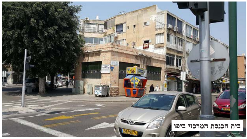
בית הכנסת המרכזי ביפו

"בית הכנסת של האדמו"ר מביטשקוב נמצא בשכונה ערבית