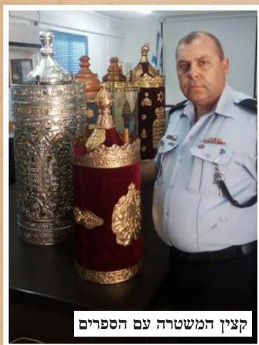
קצין המשטרה עם הספרים