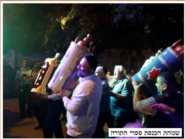
שמחת הכנסת ספרי התורה