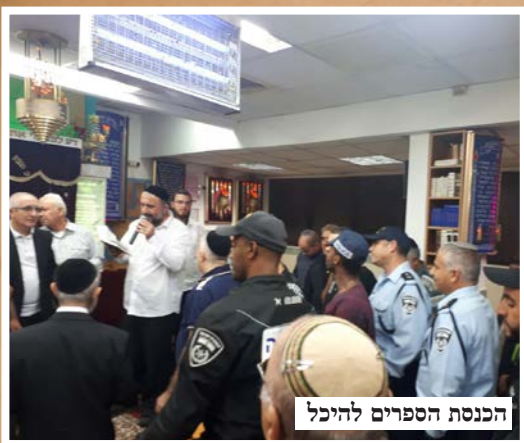
הכנסת הספרים להיכל