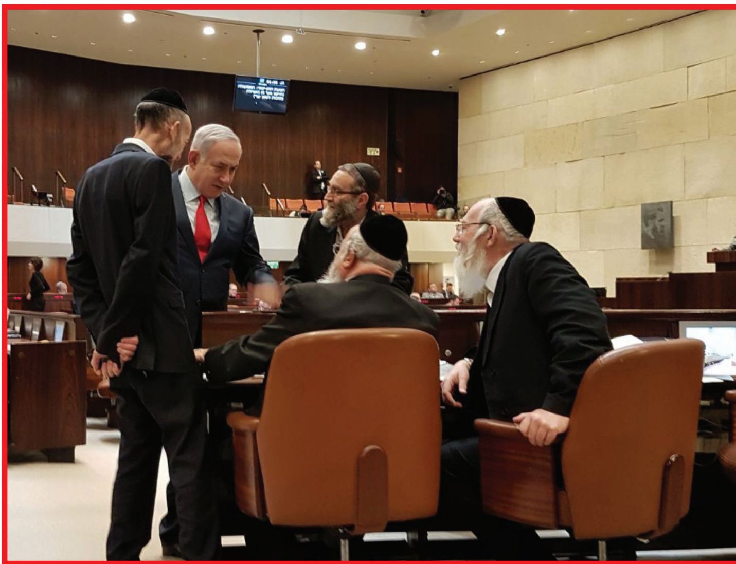
מנכס לנטל. נתינו וחברי הכנסת החרדים

כשהציבור ימאס ויקיא את האיש ומשפחתו, גם אנחנו, שנצמדנו עד תום, נראה כחלק בלתי נפרד ממשפחת נתינו המורחבת. בפרפרזה לסיסמה הישנה מ-96' ניתן לקבוע כיום שנתניהו, רע לחרדים