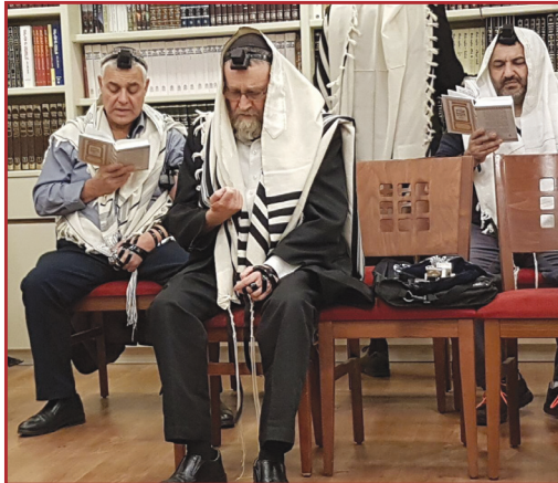
הח"כים החרדים בתפילת שחרית אחרי ההצבעה

בלית ברירה, ולאחר שהנציגים החרדים סירבו לניסיונות השר יריב לוין לשכנע אותם לוותר על תיקון ההסתייגות, הוריד יו"ר