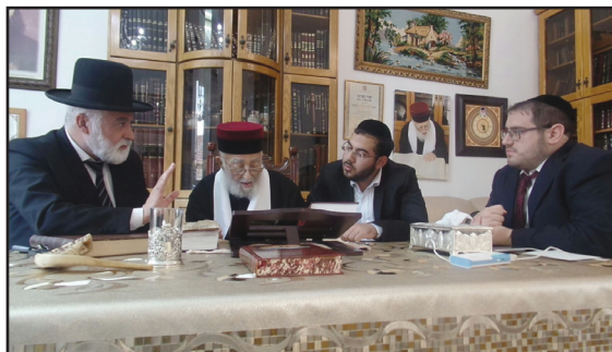
בראיון ל'קו עיתונות' לפני ראש השנה

יראת שמיים. היה מתפלל מילה במילה. ברכת 'אשר יצר' היה לוקח לו כמה דקות. היה מיוחד בשמירת עיניים, צריך שלא יהיה מצב שהצדיק אבד ואין איש שם על לב, כל אחד ילמד מדרכו מה שאפשר, לא כל אחד יכול להגיע לדרגות הללו, לא כל אחד היה יכול להילחם כפי שהוא נלחם בבית הדין בנהריה, אבל ללמוד ממנו מיראת השמים שלו".