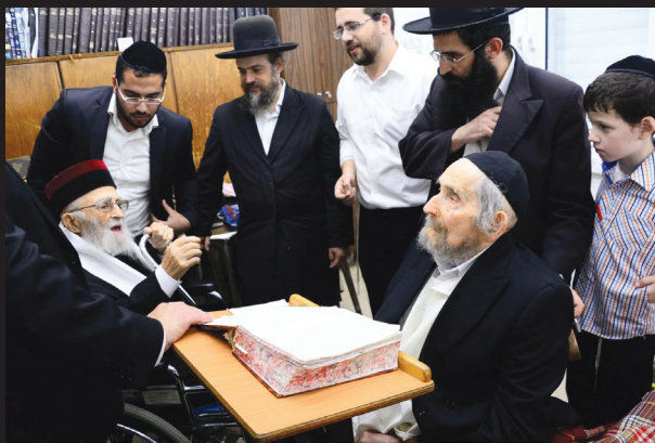
הגר"י מאמאן ומרן הגר"י ל שטיינמן