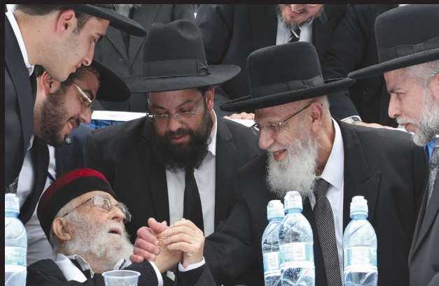
הגר"י מאמאן ויבל"ח מרן הגר"ש כהן