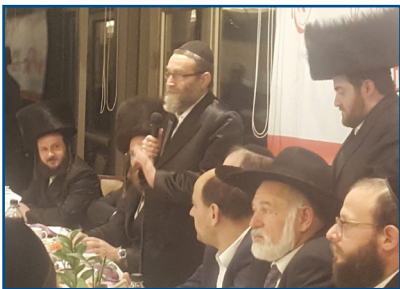
גפני נושא דברים בקיבוץ לביא

מכל מקום, עד שאתה מספיק לכעוס על שלוחי דרבנן, ולתהות מה קרה להם שכל ציוץ עיתונאי מוציא אותם משלוותם, הוכיחו הללו שטרם נס ליחס, ורשמו בלי רעש וצלצולים (טוב, כמעט) את אחד ההישגים הכי גדולים בהיסטוריה של הפוליטיקה הכלכלית החרדית בישראל, ואולי הגדול שבהם - הכנסת תקציב הישיבות לבסיס התקציב.