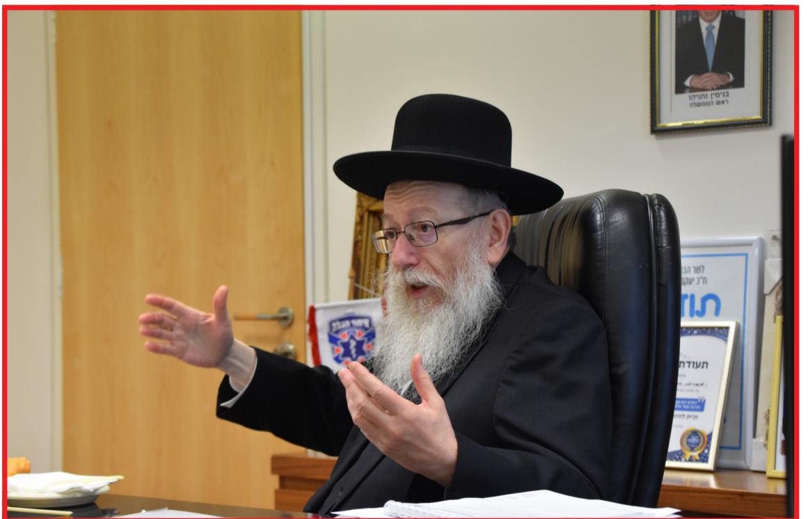
לא מעניין אותו התקשורת, ליצמן בראיון ל'קו עיתונות'.

ישי התייצב אז לבדו מול כל העולם ואשתו (של נתניהו). הזוג נתניהו, לא רק שלא זיהה למן הרגע הראשון את הבעיה, אלא אף צידד מלכתחילה בפתרונות שנתניהו מודל 2018 מייחס לשמאל הרדיקאלי, כאשר בה בשעה הגברת המשכילה עושה שימוש בתוארה כפסי-כו-לו-גית כדי להעצים את הפגיעה בשר הספרדי נטול התארים. "אלי היקר שלום", כתבה הגברת לשר הפנים תקופה קצרה אחרי שהתקיימה השיחה שתוכנה הודלף השבוע בקול תרועה רמה, "אני פונה אליך כאם לשני בנים צעירים וכפסיכולוגית בשירות הציבורי.