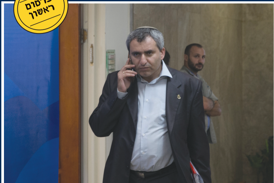
אלקין.

בעקבות ההבנה כי ברקת ככל הנראה לא יתמודד שוב לראשות העיר, השר לענייני ירושלים זאב אלקין שוקל להתמודד לתפקיד • אלקין שומר על יחסים טובים עם הסיעות החרדיות וצפוי להחליש את יתר המועמדים • במקביל, גם יו"ר הקואליציה ח"כ אמסלם שוקל להתמודד ומצהיר בראיון ל'קו עיתונות': "אקבל החלטה כשנתקרב לבחירות"