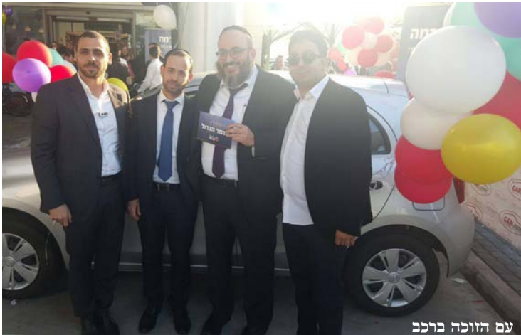
עם הזוכה ברכב