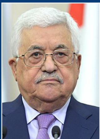
אבו מאזן.

טראמפ אמר גם כי "אנחנו בטח ניפגש בעתיד הלא רחוק", אולם דוברת הבית הלבן שרה האקבי סנדרס טענה בתדרוך כי "שום דבר לא מתוכנן כעת". הבית הלבן סירב להגיב באשר לחומרים שהוצגו לנשיא כהכנה לפגישה. גורמים המעוררים בעניין, אמרו שהן כללו הנחיה שלא לברך את פוטין. עם זאת, בכיר בממשל הדגיש כי היועץ לביטחון לאומי, הרברט מקמסטר, לא אמר זאת לנשיא בשיחת ההכנה שאותה קיים טראמפ מאגף המגורים בבית הלבן.