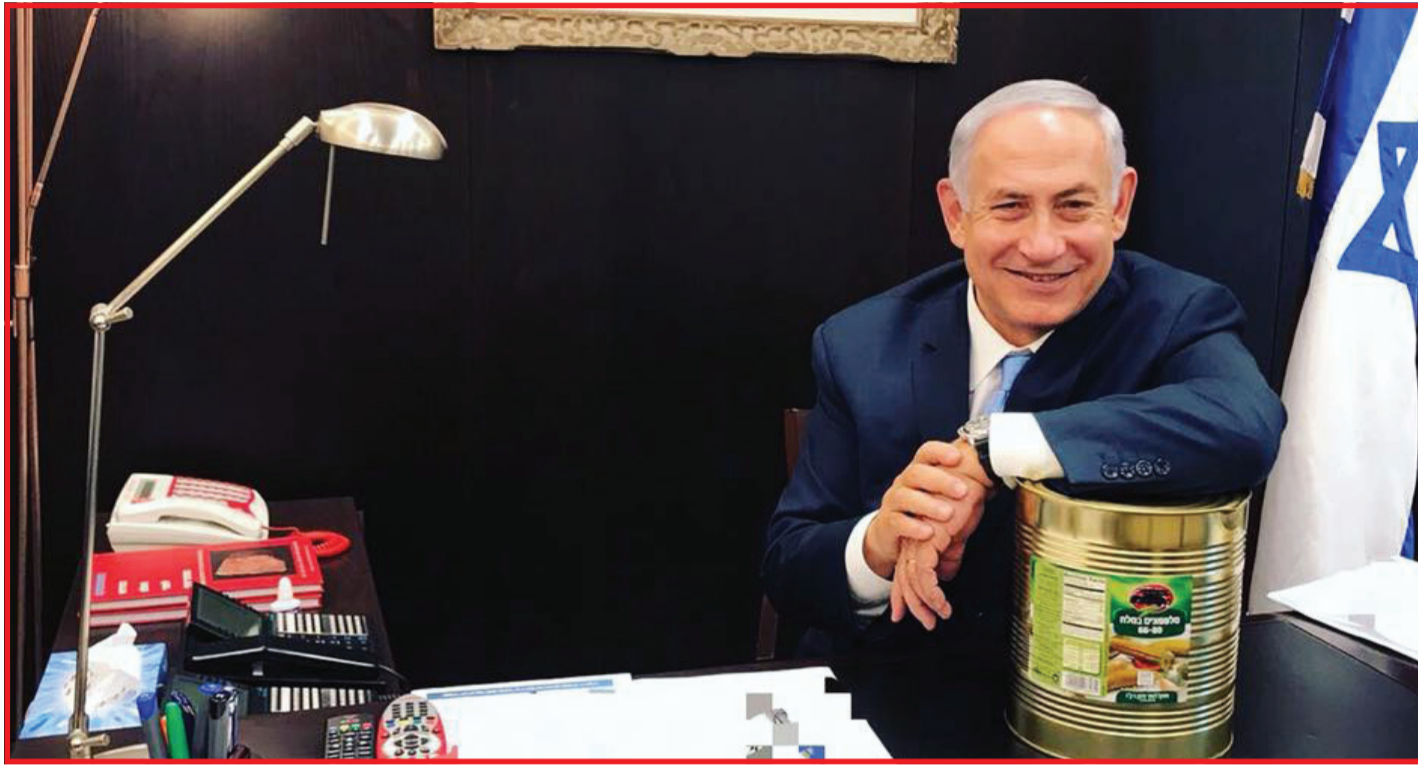
חמוץ-מתוק. נתניהו בלשכתו אחרי נאום החמוצים, השבוע

נשמה בחדר סיעת ש"ס לזכרו של מרן. בקצב המשגים של ביבי כלפי דרעי, הוא עוד יירדש, כאקט ניחומים, לחתום על מנוי ל'הדרן'.