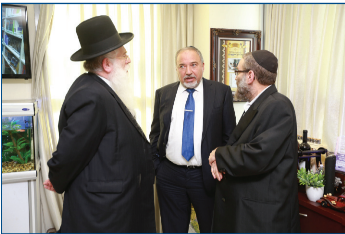
פרוש וגפני עם שר הביטחון

בשבוע שבו חוזרת הכנסת לפעילות ושכבר בתחילתו אין ספק כי הנושא החם ביותר שיוביל את המושב הבא הוא חוק הגיוס, שבוטל על ידי בג"ץ וחוזר לחקיקה מתוקנת בכנסת, כאשר על פי הערכת כל הגורמים המעורבים תסתיים החקיקה עוד במושב הנוכחי ולכל המאוחר בפתח מושב הקיץ שיבוא אחריו. לצורך כך הוקמה וועדה, בה חברים נציגים מכל מפלגות הקואליציה, אלא שאחרי המפגש הראשון שהתקיים לפני חג הסוכות, ולמרות רצון כלל השותפים בקואליציה להגיע להסכמות בעניין החוק כדי להגישו בהזדמנות הקרובה - 'קו עיתונות' חושף כי הדרך לא תהיה קלה.