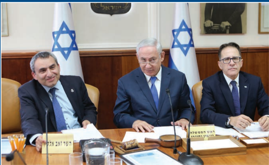
נתניהו בישיבת הממשלה

על רקע חקירות ראש הממשלה ויזומת החקיקה לאסור חקירת ראה"מ, נפתח מושב החורף של הכנסת בסערה • הנשיא ריבלין נשא נאום אופוזיציוני תקיף ונתניהו הבריק עם נאום 'החמוצים'