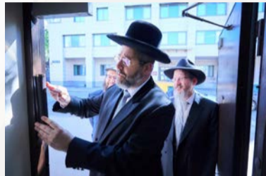
הסמוכה ומסר שני שיעורי תורה לרבים. משם יצא בליווי הגר"ב לאזאר לסלון הספרי היהודי החדש ברוסיה והגדול שהוקם

למחרת הגיע האורח לתפילת שחרית בבית הכנסת המרכזי 'מארינה רושצה', הניח תפילין לשני נערי בר מצוה תלמידי