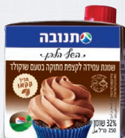
שמנת עמידה לקצפת מתוקה בטעם שוקולד 32% שוקולד 250 מ"ל