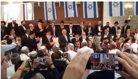
נתניהו במרכז הרב