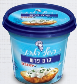
קרם פרש 30% 200 גרם