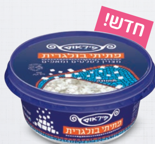
פתיית בולגרית 220 גרם