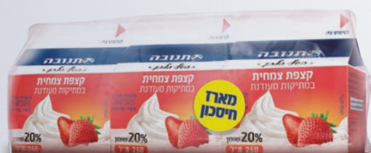
מארז שלישיית קצפת צמחית 250 מ"ל X 3 יח'