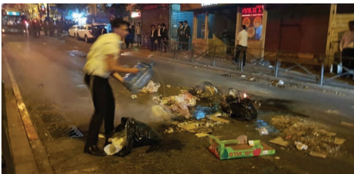
אילוסטרציה. צילום: מחאות החרדים הקיצוניים

אלפי מפגינים התכנסו בצהרי שבת האחרונה בכיכר השבת, להפגנה שארגנה 'העדה החרדית' במחאה על חילולי השבת בבירה ובמרכז מרוץ האופניים שהתקיים שבוועד קודם לכן, תוך חילולי שבת רבים ובשתיקת הנציגים החרדיים. לקראת מוצאי יום מנוחה, יצאו המפגינים לכיוון צומת בר אילן וחסמו את התנועה בין הצומת לבין שדרות לוי אשכול. עד מהרה ההפגנה יצאה משליטה והיא נגררה למחוזות אלימים. לצד אלפי המפגינים, התגוררו מספר תושבים חילוניים, שהחליפו ביניהם צעקות ודברי זעם. על פי עדויות הנוכחים, אחד התושבים שלף אגרופו ותקף בו מפגין, שנפצע באורח קל-בינוני. "כשהגעתי למקום, הענקו טיפול רפואי ראשוני לצעיר כבן 30 שסבל מחבלות ופציעות בראשו ובפלג גופו העליון. הפצוע פונה להמשך קבלת טיפול רפואי בבית החולים כשמצבו מוגדר קל עד בינוני", סיפר נחום ברנשטיין, ראש סניף ציון-ירושלים באיחוד הצלה.