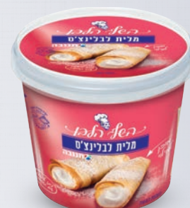
מלית לבלינצ'ס 250 גרם