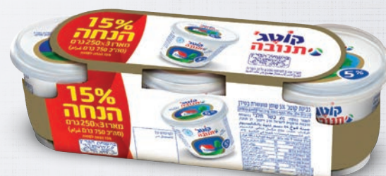
מארז שלישיית קוטג' תנובה 5% 250 גרם X 3 יח'