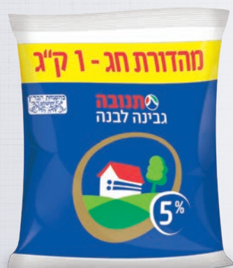
שקית גבינה לבנה תנובה 5% 1 ק"ג