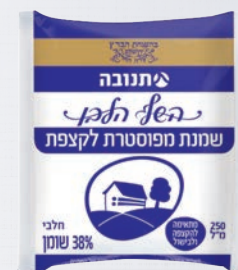
שמנת מפוסטרת לקצפת 38% 250 מ"ל