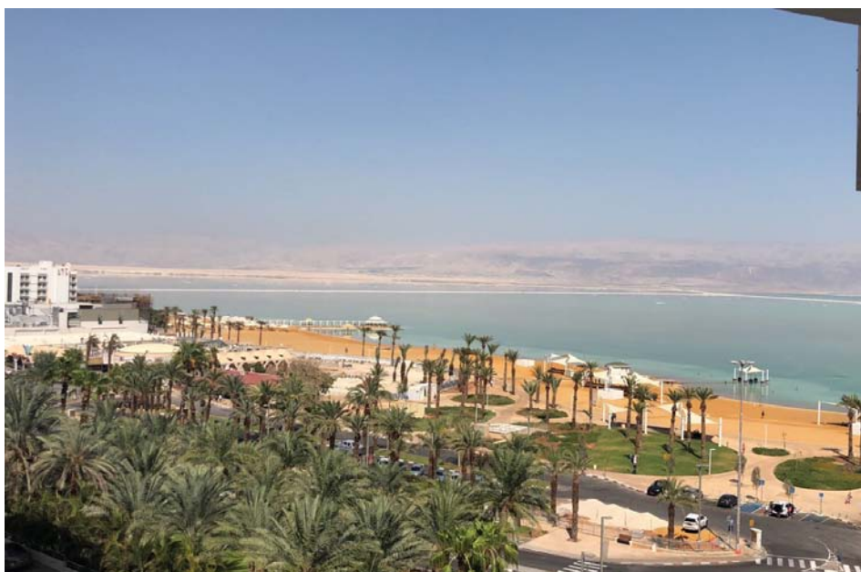
ממרפסת המלון בים המלח, כאן נכתב הטור

התנהלותו של ראש הממשלה מול משבר חוק הלאום והדרוזים צריכה להילמד בבתי ספר לפוליטיקה. לפי איך