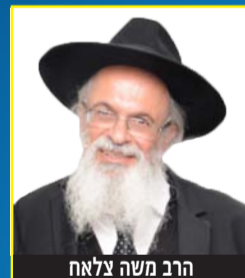
הרב משה צלאח