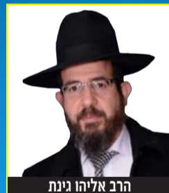
הרב אליהו גינת