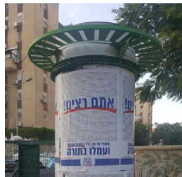
קמפיין פתיחת זמן חורף עם שמות תלמידי הישיבה המתגוררים בעיר

במטה 'יהדות התורה' בפתח תקווה פועלים במלוא המרץ להביא לידי ביטוי את כוחו של ציבור הבוחרים התורני במערכת הבחירות המתקרבת. נציגי הציבור, גבאי בתי הכנסת ופעילים רבים נרתמו למערכה תוך הבנת גודל האחריות כלפי המשך התפתחות הציבור התורני בעיר, על כל המשתמע מכך.