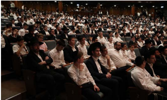
מאת: אלי כהן

בסיומו של חודשי פעילות עמוסים בשיעורי תורה, בישיבות בין הזמנים, בשמחות בית השואבה והקפות שניות בהיכלי הישיבות ובתי המדרש בפתח תקווה שהיו בחסות היחידה לחינוך חרדי - התכנסו למעלה מאלף בחורי ישיבה והוריהם, יחד עם המוני בני התורה למעמד שכבר הפך למנהג טוב של קבע בעיר - מעמד 'כתבם על לוח לבך' של הוקרת הציבור לבני התורה לבני הישיבות שגם בימי בין הזמנים שוקדים על תלמודם ומעלים על הכתב ממיטב החבורות שלמדו ועמלו עליהם בכל השנה כולה, יחד עם שירה מרגשת באווירה ישיבתית ושמיעת דברי חינוך לקראת הזמן החדש.