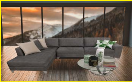
סלון בריפוד לפי בחירה 2+3/ספה ארוכה/פינתי