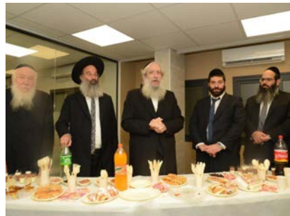
דברי ברכה בטקס למוקד

בארגון השומרים מסכמים בסיפוק רב את המבצע ורואים בחיוב את המשך שיתוף הפעולה בין מתנדבי הארגון ליחידות המשטרה השונות, דבר שהביא לא פעם למעצר עבריניים שפעלו בעיר והפרו את שלווה של תושבי בני ברק. מוקד השומרים זמין לשירות הציבור 24 שעות ביממה: 1700700963