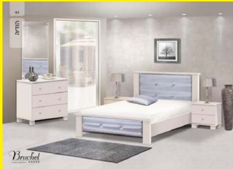
חדר שינה כולל מיטות יהודיות, שידות, קומודה, מראה, ארגזים מעץ סנדוויץ' ומזרנים אורטופדיים לבחירה 3 עיצובים שונים של חדרים