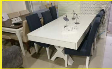
פינת אוכל + 6 כסאות ופתיחה, צבעים לפי בחירת הלקוח