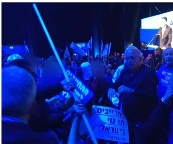
מהומות בין פעילים, בזמן נאום גבאי

רסק אתה מאשים אותנו, יש גבול, הכישלון הזה הוא 'נטו גבאי'. טעיתי בקשר אליך". לפני כשבוע, טען כבל כי גבאי אמר לו בשיחה שהוא "ימוטט את הבית הזה על כולנו", גבאי הכחיש את הדברים, ובתגובה, שלף כבל בנאומו בדיקת פוליגרף שהוכיחה כי הדברים שציטט נכונים. "אתה שיקרת ולא בפעם הראשונה", אמר והגיש לגבאי את תוצאות הפוליגרף.