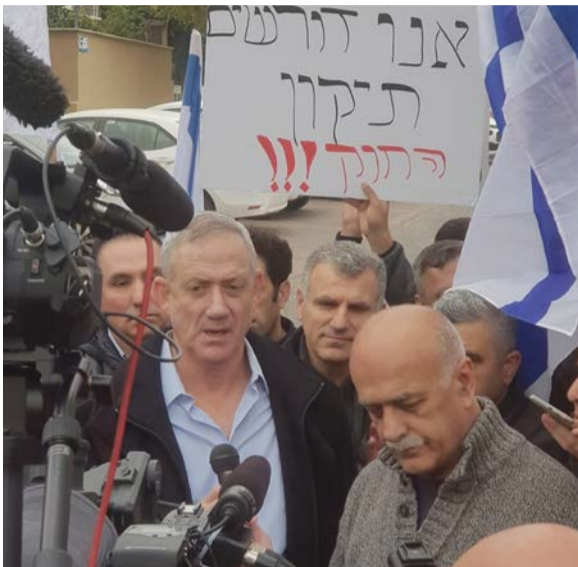
גנץ עם אנשי העדה הדרוזית

אחרי טפטוף של תגובות קצרות, נתן בני גנץ הופעה תקשורתית ראשונה בהזדהות עם העדה הדרוזית • דוברי הימין מתאמצים להשחיר את פניו, וכולם ממתנינים להכרזה רשמית