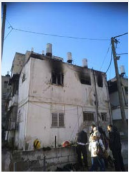
זירת הטרagedיה.

בשעה מוקדמת של יום שלישי, הוזעקו כוחות ההצלה והחירום לבניין ברחוב בלפור בבת ים, לאחר קבלת דיווח על שריפה שפרצה בדירה בקומה השנייה. הכוחות שפרצו אל תוך הלהבות, מצאו גבר כבן 90 כשהוא ללא רוח חיים ועל גופו סימני כוויות קשות. אשה