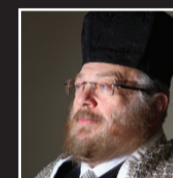
חיים אדלר החזן העולמי