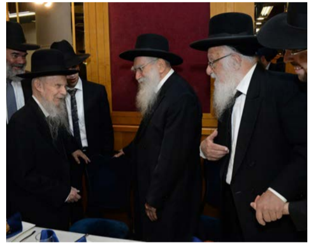
עם מרן הגר"ג אדלשטיין.