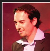
עמירן דביר הזמר והיוצר