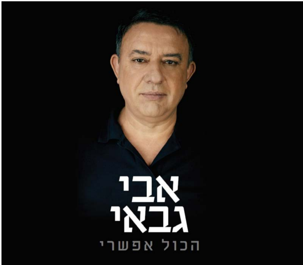
די לרדיפה. ספרו החדש של אבי גבאי

האובססיבית אחרי גיוס חרדים ויהיה סל הטבות נרחב לאלה שכן מתגיסים. פשוט כך: במקום לגייס את החרדים בכפייה, ניתן גזרים לילדים שלנו. ניתן לחיילים שכר הוגן, נעניק להם עדיפות בקבלה לאוניברסיטה, נעניק להם יתרון וזכויות בדיור. כך נתגמל את אלה ששירתו שלוש שנים בצבא וסיכנו את חייהם, נשחרר את החרדים מתחושת האנטי ומתחושת הרדיפה, וניצור הוגנות במקום שנאה.