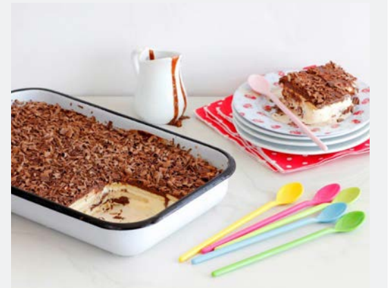
מתכון, צילום וסטיילינג: נטלי לזין עבור שוקולד פרה

עוגת גלידה עם ביסקוויטים, קרה וקלה להכנה המשלבת שתי קינוחים קלאסיים אהובים - עוגת גלידה ועוגת ביסקוויטים - במתכון אחד! שכבות של ביסקוויטים פתי בר במילוי גלידת וניל רכה וקדם שוקולד עשיר במיוחד. זוהי עוגת גלידה עשירה במיוחד, קוצרת מחמאות ומושלמת לאירוח קיצי!