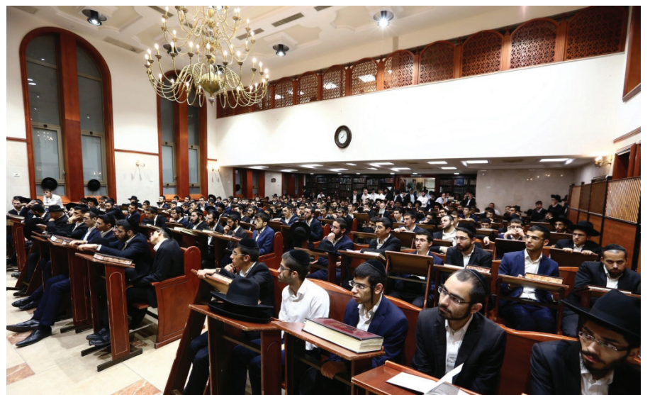
ישיבת באר יהודה.

לאחר מאבק של רוב הישיבות הספרדיות הגדולות והקטנות, למען דחיית המבחנים לתאריך י"א תמוז תשע"ט, הסתיימו בימים אלו הבחינות לישיבות הגדולות. המהלך זכה לברכתם של גדולי ישראל ובראשם מרן ראש הישיבה חכם שלום הכהן שליט"א וגדולי ראשי הישיבות שליט"א ונוהל בתבונה רבה על ידי העסקנים הנמרצים הרב יעקב מויאל והרב אברהם עידן על מנת למנוע ביטול תורה דרכים הנגרם על ידי המבחנים המוקדמים.