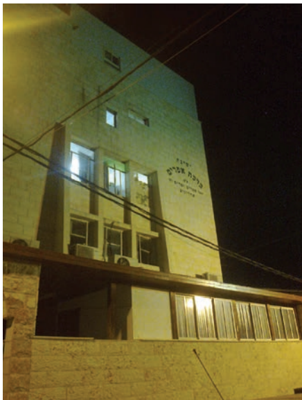
ישיבת ברכת אפרים