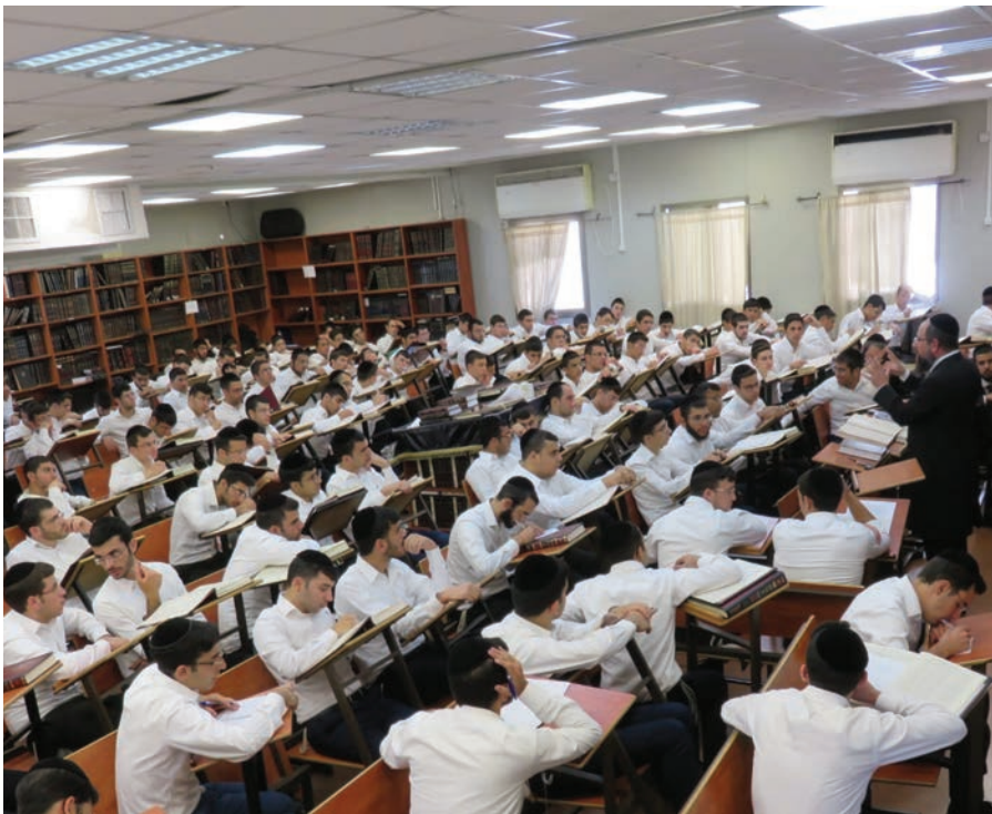
היכל ישיבת דרכי דוד

באיזו ישיבה תפתח בשנה הקרובה 2 שיעור א' ? באיזו ישיבה קיבלו 160 בחורים לזמן אלול הקרוב? לאיזו ישיבה נרשמה קבוצת תלמידים גדולה ממקסיקו? ובאיזו ישיבה משלבים את שתי שיטות הלימוד - הספרדית והליטאית?