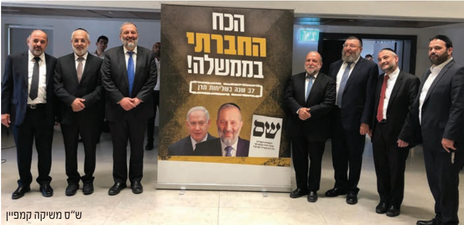
ש"ס משיקה קמפיין

לאחר שמפלגת כולנו נטמעה בליכוד, נותרה ש"ס המפלגה החברתית היחידה במחנה הלאומי • קמפיין הבחירות של המפלגה שהושק ביום שני השבוע יעמוד תחת הסיסמא: "ש"ס - הכוח החברתי בממשלה" • ולאחר שאיילת שקד הועמדה בראשות 'הימין החדש' הואצו המגעים לאיחוד עם הבית היהודי והאיחוד הלאומי • ורק אהוד ברק מחפש עם מי להתאחד אבל גם מרץ וגם מפלגת העבודה לא מעוניינים בחיבור עם מפלגתו