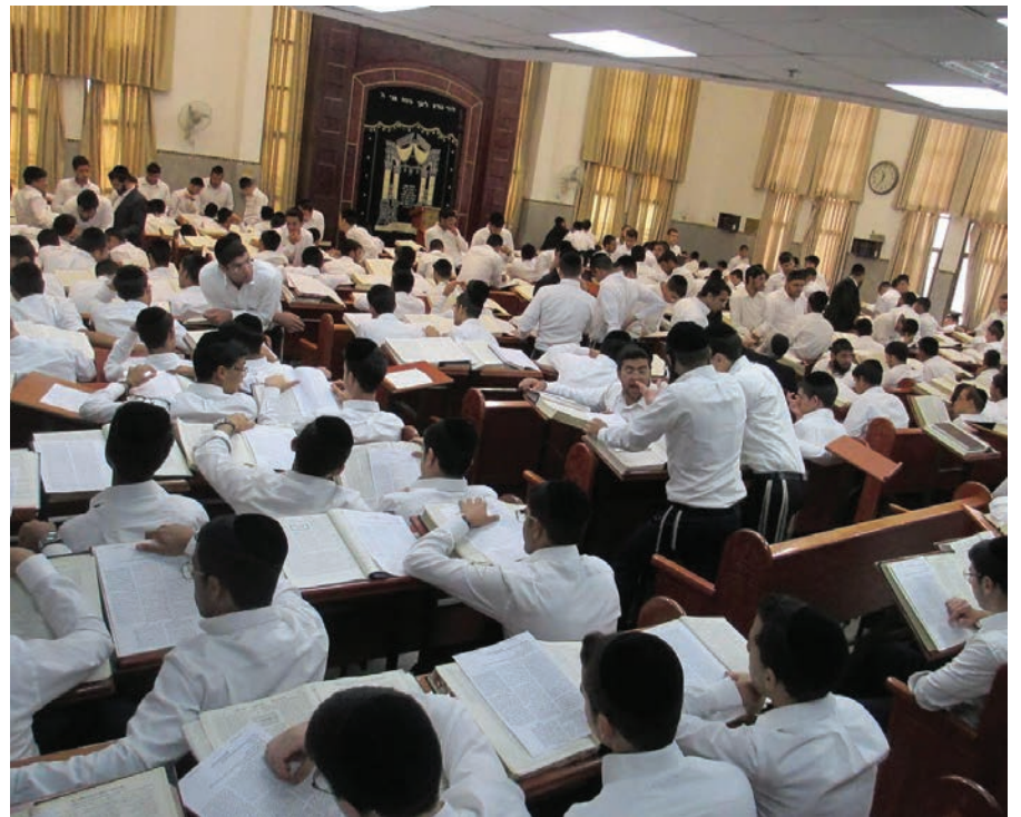
היכל ישיבת שערי תבונה