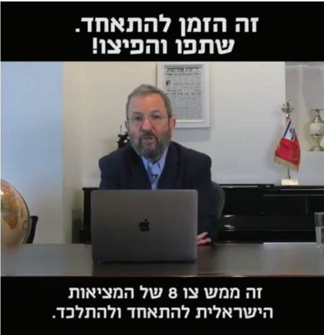
אהוד ברק בקריאה לאחדות

החיבור בין מפלגת 'העבודה' לבין מפל-גת 'גשר' של אורלי לוי אבקסיס, ספג השבוע ביקורת צולבת מאושיות שמאל, שביקרו את עמיר פרץ על המהלך. הביקורת מגיעה גם על רקע ה"ימניות" של לוי אבקסיס, גם בטענה כי הניסיון להביא מנדטים מהימין היא אשליה שלא