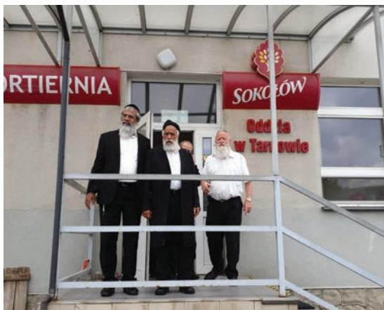
במשחטת סוקולוב בעיירה טרנוב בפולין הנמצאת תחת השגחת הגר"ש מחפוד