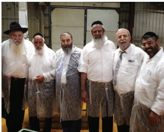
עם רבני וצוות המשחטה במוסקבה