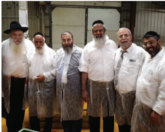
עם רבני וצוות המשחטה במוסקבה