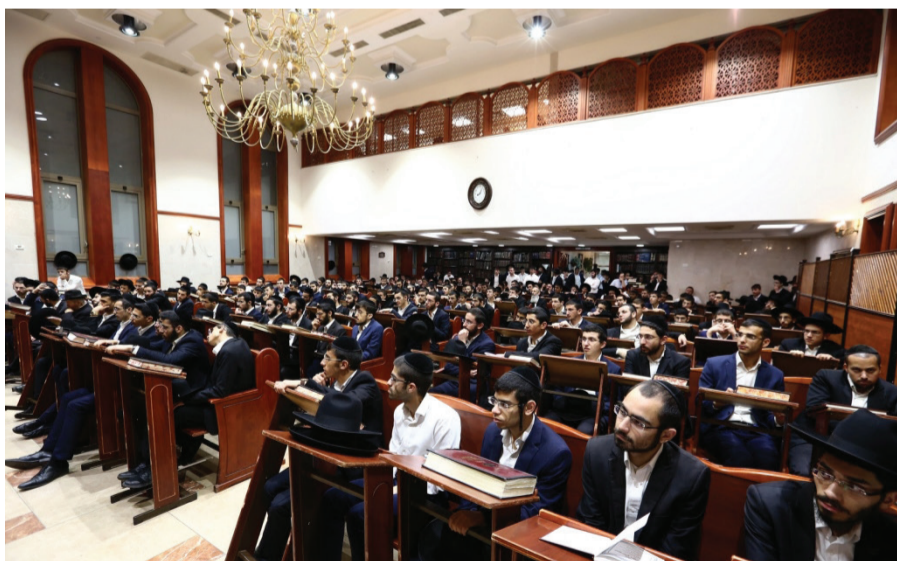
ישיבת באר יהודה.