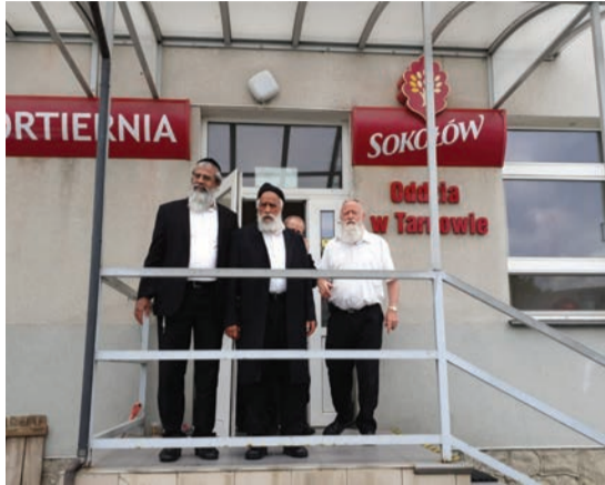
במשחטת סוקולוב בעיירה טרנוב בפולין הנמצאת תחת השגחת הגר"ש מחפוד