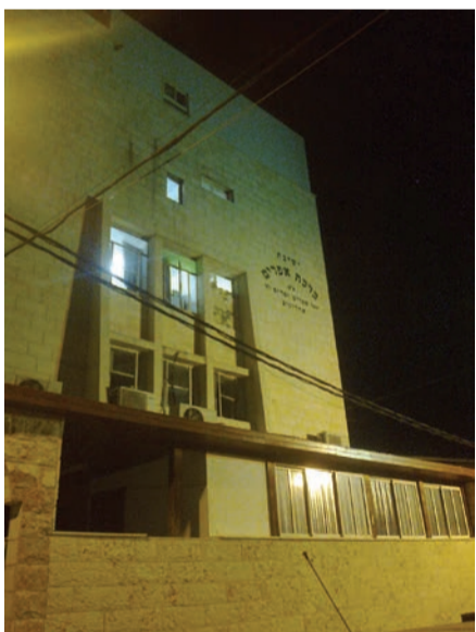
ישיבת ברכת אפרים