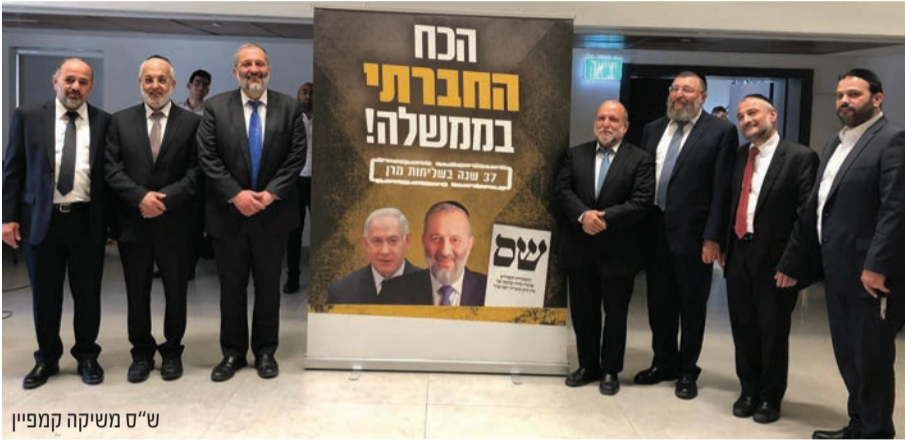
ש"ס משיקה קמפיין

לאחר שמפלגת כולנו נטמעה בליכוד, נותרה ש"ס המפלגה החברתית היחידה במחנה הלאומי • קמפיין הבחירות של המפלגה שהושק ביום שני השבוע יעמוד תחת הסיסמא: "ש"ס - הכוח החברתי בממשלה" • ולאחר שאיילת שקד הועמדה בראשות 'הימין החדש' הואצו המגעים לאיחוד עם הבית היהודי והאיחוד הלאומי • ורק אהוד ברק מחפש עם מי להתאחד אבל גם מרץ וגם מפלגת העבודה לא מעוניינים בחיבור עם מפלגתו