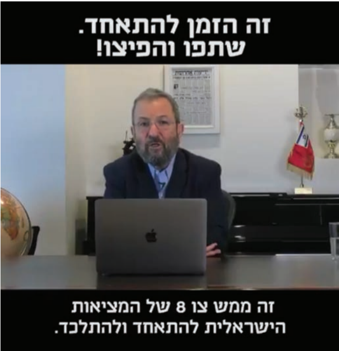
אהוד ברק בקריאה לאחדות