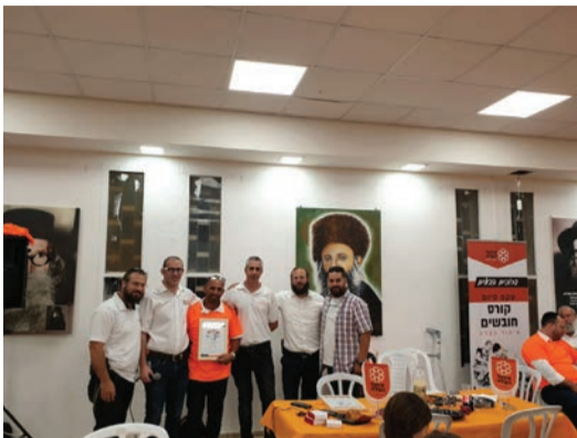
המתנדבים החדשים של איחוד הצלה

אחרי קורס ארוך, הצטרפו עשרות מתנדבים חדשים לשורות ארגון 'איחוד הצלה' בראשון לציון