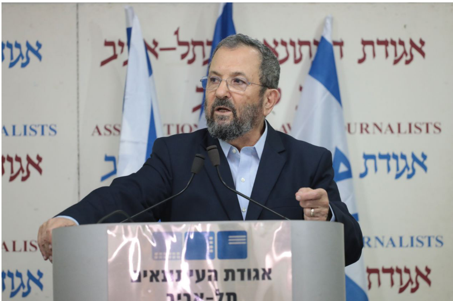
קולות פיוס במקום קריאות גיוס. אהוד ברק במסיבת העיתונאים