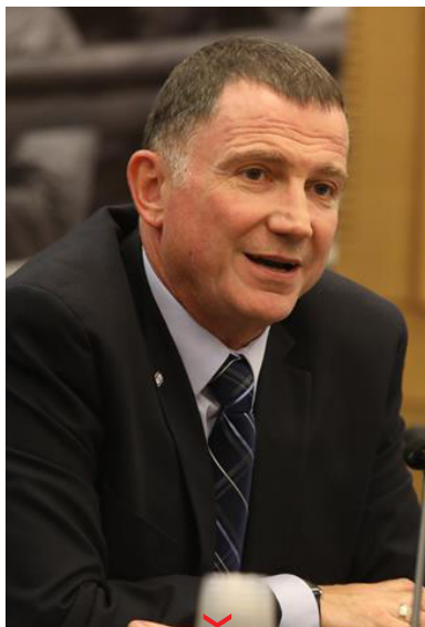
שליחותו של הממונה. יו"ר הכנסת אדלשטיין

אופציית ההתחמקות מכתב אישום מסתמנת כבלתי אפשרית. המטרה המעודכנת של ביבי בהתאם לתנאי הטיסה ולדלק שנותר במכלים, היא להגיע לבית-המשפט כשהוא מוקף בסוללת מאבטחי השב"כ. ורק אל תאמרו (עדיין), את המילה שב"ס