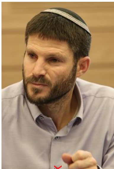
קמיקזה בשדה דב. סמוטריץ'