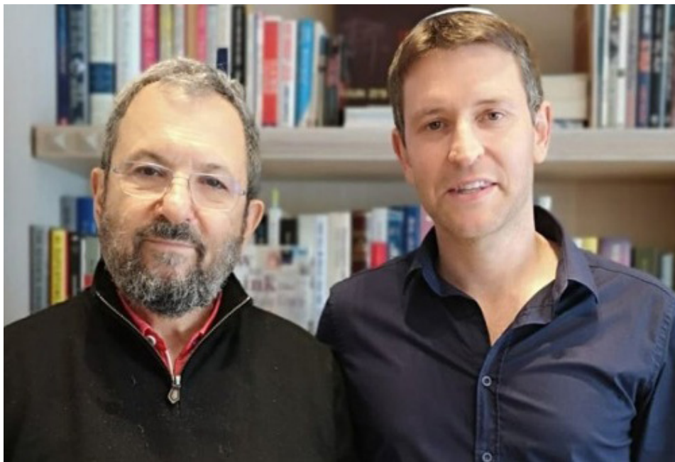
אהוד ברק עם הרכש הדתי למפלגתו, יאיר פינק

"חוק הגיוס זה ישראבלוף", אמר ברק והדגיש: "נדאג להסדרה מכבדת לקבוצת לומדי תורה מצטיינים שתורתם אומנותם. כחלק מהמסורת והמחויבות היהודית" • המסר של ברק לציבור החרדי: ביטול חוק הגיוס, תוכנית לשילוב חרדים בשוק העבודה ובחברה הישראלית • האם נתניהו צריך להתחיל לדאוג מ"השותפים הטבעיים"?