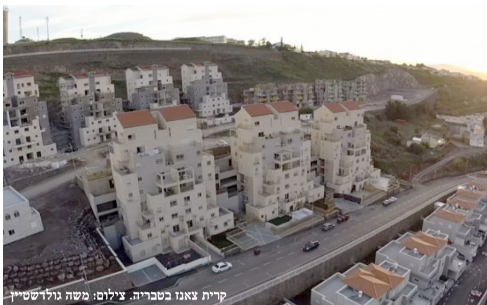
קרית צאנו בטבריה.

בס"ד יום רביעי י"ד תמוז תשע"ט 17/7/19 • כלכלה • נתח שוק • נדל"ן • פרסום • שווקים • צרכנות • מחשבים • רכב • לוח • קו עיתונות