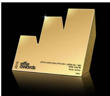
פרס הזהב בתחרות האפי 2019

איכות החיים, את ההרגשה האישית ואת האווירה המשפחתית. כשאוכלים טוב מרגישים טוב יותר, ומוצרי טרה מאפשרים לכל אחד להכניס הביתה תזונה טובה יותר עם מוצרי חלב טעימים ואיכותיים.