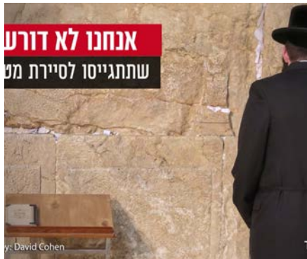
מתוך סרטון התעמולה של ישראל ביתנו

ביום ראשון, כינסה מפלגת העבודה 'מסיבת עיתונאים' מיוחדת ובה נמסרה הודעה "דרמטית": "...ח"כ איציק שמולי נשאר במפלגה. ההודעה מגיעה על רקע לבטים ארוכים של שמולי, תוך שהוא שוקל לחבור למחנה הדמוקרטי, אך לבסוף החליט להיותר בביתו הפוליטי, לא לפני שמתח ביקורת על יו"ר מפלגתו על התעקשותו שלא לחבור למפלגות האחרות בגוש. על פי הסיכומים, שמולי יוצג בפרסומי הבחירות כחלק מההנהגה לצד לוי אבקסיס ופרץ, והוא יהיה אחראי על הקמפיין.