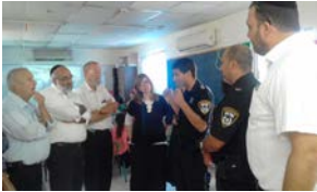
סיור בביה"ס בנות מוריה