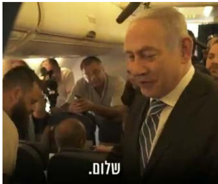
נתניהו מקבל פני עולים במטוס

במסגרת המאבק על הקול הרוסי, הטריח את עצמו ראש הממשלה בנימין נתניהו לנתב"ג, לקבל פנים לעולים מברית המועצות. נתניהו שוחח, הצטלם וחילק דרכונים. השבוע פורסם כי נשיא רוסיה פוטין צפוי לבקר בישראל לפני הבחירות, וכי נתניהו ביקש מעיריית ירושלים למהר לאשר הצבת אנדרטה שתמנף את הביקור. הידיעה הוכחשה. עוד במסגרת המאבק על קולות עולי ברית המועצות: נתניהו צפוי לצאת בחודש הקרוב לביקור באוקראינה.