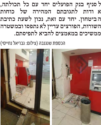
הכספת שנגנבה

ממקומו לאחר שנקשר לרכב אתו הגיעו הפורצים. לאחר מכן הוא הועמס על רכבם ואלו נמלטו מהמקום, כאשר הפעולה כולה לקחה כ-10 דקות. הפריצה עצמה לא עברה בצורה שקטה ועוברי אורח ושכנים צעקו לעברם, בניסיון למנוע את הגניבה, כאשר המשטרה עצמה הגיעה למקום באזור השעה 4:15. לאחר שהפורצים נמלטו מהמקום, שוטרים מתחנת משטרת ראש העין החלו במרדף אחריהם. רעולי הפנים נכנסו יחד עם הכספת הנעולה אל יער סמוך לעיר, אך אז הבחינו בניידת משטרה שנעה בעקבותיהם. בעקבות כך הם נטשו את הכספת, שעדיין נשארה נעולה יחד עם כל תכולתה, ונמלטו מהמקום. במשטרה אספו את הכספת וזו הוחזרה