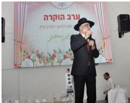
מאת: אלי כהן

ערב הוקרה מיוחד למאות עובדות 'מעייין החינוך התורני' בפתח תקווה