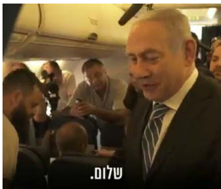
נתניהו מקבל פני עולים במטוס

במסגרת המאבק על הקול הרוסי, הטריח את עצמו ראש הממשלה בנימין נתניהו לנתב"ג, לקבל פנים לעולים מברית המועצות. נתניהו שוחח, הצטלם וחילק דרכונים. השבוע פורסם כי נשיא רוסיה פוטין צפוי לבקר בישראל לפני הבחירות, וכי נתניהו ביקש מעיריית ירושלים למהר לאשר הצבת אנדרטה שתמנף את הביקור. הידיעה הוכחשה. עוד במסגרת המאבק על קולות עולי ברית המועצות: נתניהו צפוי לצאת בחודש הקרוב לביקור באוקראינה.