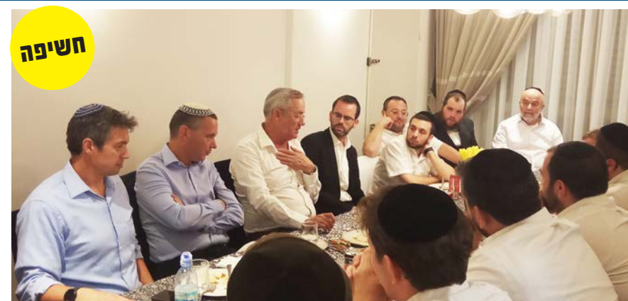
ח"כ בני גנץ בביקורו בבני ברק

יו"ר 'כחול לבן' הגיע לסיור ליל-שישי בבני ברק והתיישב לשיעור גמרא ולשיח עם תושבים • על יחסי דת ומדינה: "הסוגייה לא צריכה להיות הפרדת דת ומדינה אלא הסדרת דת ומדינה, בסוף, אנחנו מדינה יהודית עם ערכים יהודיים ומסורת יהודית" • על יאיר לפיד: "הוא לא אנטי יהודי, תפיסתו חילונית, ישרה, עמוקה – לשיטתו. לכל אחד יש את הגוונים שלו, אני מציע לכולנו: בואו נימנע מפסילות"