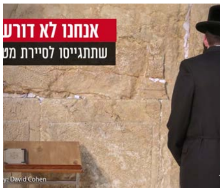
מתוך סרטון התעמולה של ישראל ביתנו

ביום ראשון, כינסה מפלגת העבודה 'מסיבת עיתונאים' מיוחדת ובה נמסרה הודעה "דרמטית": "...ח"כ איציק שמולי נשאר במפלגה. ההודעה מגיעה על רקע לבטים ארוכים של שמולי, תוך שהוא שוקל לחבור למחנה הדמוקרטי, אך לבסוף החליט להיותר בביתו הפוליטי, לא לפני שמתח ביקורת על יו"ר מפלגתו על התעקשותו שלא לחבור למפלגות האחרות בגוש. על פי הסיכומים, שמולי יוצג בפרסומי הבחירות כחלק מההנהגה לצד לוי אבקסיס ופרץ, והוא יהיה אחראי על הקמפיין.