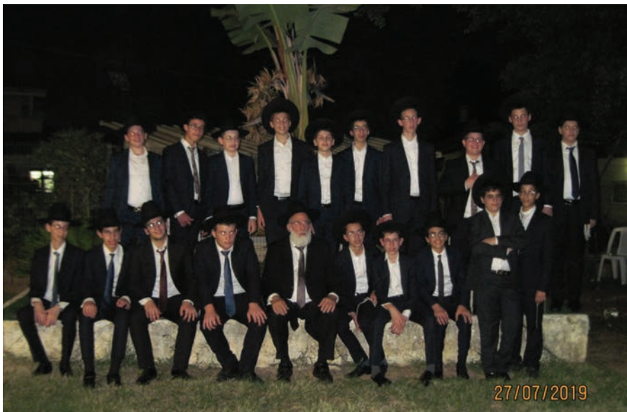
מאת: אלי כהן

מצטייני כיתות ח' של ישיבת המתמידים 'חברותא לאורייתא', יצאו לשבת התעלות בראשון לציון, לא לפני שקפצו להתאוורר בבריכה