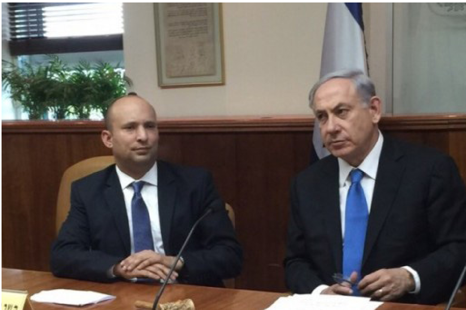
התמונה שבבלפור קיוו שתהיה נחלת ההיסטוריה. נתניהו ובנט