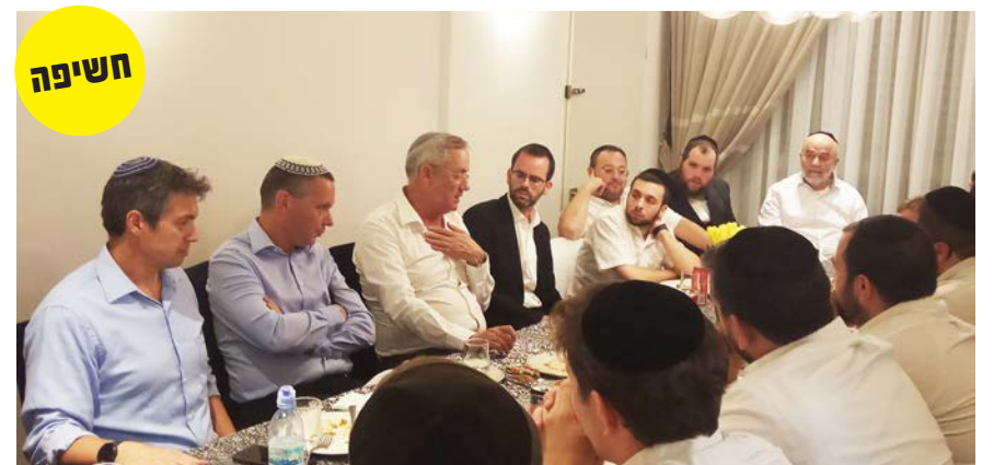
מאת: ישראל פריי

לצד זאת, גנץ העביר מסר ללפיד: "אני אומר ליאיר, כל מתאגרף יודע שמתאגרפים מתחבקים בזירה ומשיגים שני דברים: 1. הם נחים קצת מהמכות. 2. המנוף נהיה יותר קטן ואז האגרוף פחות כואב. אני חושב שאם נהיה מחובקים אחד עם השני כמו שאנחנו כעת, יושבים, מכירים, מדברים – הכל פחות כואב". גנץ שיתף בתפיסת עולמו, המבקשת להכיר ולחזק את הערכים היהודיים של מדינת ישראל. "בימים האחרונים אני עוסק עם עצמי בשאלה האם אנחנו צריכים הפרדת דת ומדינה או הסדרת דת ומדינה. כלל שהזמן עובר אני יותר ויותר חושב שהסוגיה היא 'הסדרת דת ומדינה' כי בסוף, אנחנו מדינה יהודית עם ערכים יהודיים ועם מסורת יהודית".