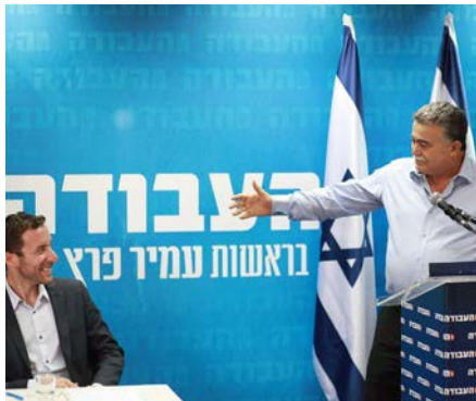
פרץ עם שמולי במסיבת ההישארות.

ביום חמישי יסתיים מועד הגשת הרשימות לקראת הבחירות לכנסת ה-22 • במחנה הימין, הבית היהודי והאיחד הלאומי סגרו עם הימין החדש כאשר איילת שקד תעמוד בראשות הרשימה, אולם נעשים מאמצים לצרף גם את 'עוצמה לישראל' ואת 'זהות' • בשמאל, האיחוד של מרץ עם ברק הציל לפחות אחת משתי המפלגות מאימת אחוז החסימה, אך מאחורי הקלעים נעשים מאמצים לצרף גם מפלגת העבודה לאיחוד במחנה השמאל