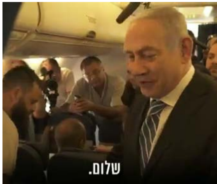
נתניהו מקבל פני עולים במטוס

במסגרת המאבק על הקול הרוסי, הטריח את עצמו ראש הממשלה בנימין נתניהו לנתב"ג, לקבל פנים לעולים מברית המועצות. נתניהו שוחח, הצטלם וחילק דרכונים. השבוע פורסם כי נשיא רוסיה פוטין צפוי לבקר בישראל לפני הבחירות, וכי נתניהו ביקש מעיריית ירושלים למהר לאשר הצבת אנדרטה שתמנף את הביקור. הידיעה הוכחשה. עוד במסגרת המאבק על קולות עולי ברית המועצות: נתניהו צפוי לצאת בחודש הקרוב לביקור באוקראינה.