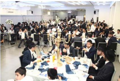
תלמידי הישיבה באירוע