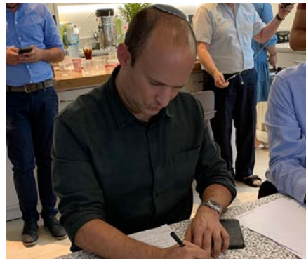
בנט חותם על הסכם האיחוד בימין

המפלגות הערביות מציגות אחדות שורות, כאשר כל התנועות ירוצו תחת מפלגה אחת. האחרונה להצטרף לעגלת הבחירות הייתה