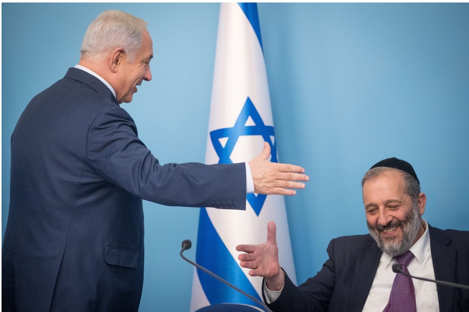
המחזזה והמוזה. רה"מ נתניהו ושר הפנים דרעי