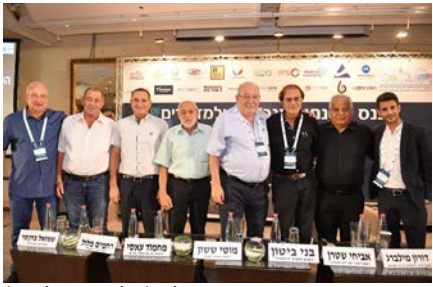
בכנס המנכ"לים

ראש העיר הוזמן לשאת דברים בפאנל "ישן מול חדש" שנערך למנכ"לים ברשויות המקומיות והפציר בהם שלא לזלזל בקודמיהם בתפקיד ובניסיון החיים העשיר שמלווה אותם