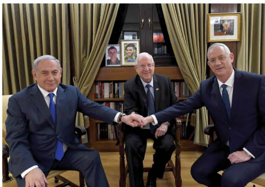
הפגישה המשולשת בבית הנשיא

שבוע לאחר הבחירות והערפל הפוליטי עדיין לא התבהר הפגישה בין נתניהו לגנץ שכפה נשיא המדינה ראובן ריבלין לא הסירה את הערפל הפוליטי: בליכוד לא מתכוונים לבגוד בבחור של מחנה הימין ובכחול לבן לא מתכוונים להפר את ההבטחה המרכזית של הבחירות שלא לשבת יחד עם נתניהו | עמ' 18-19