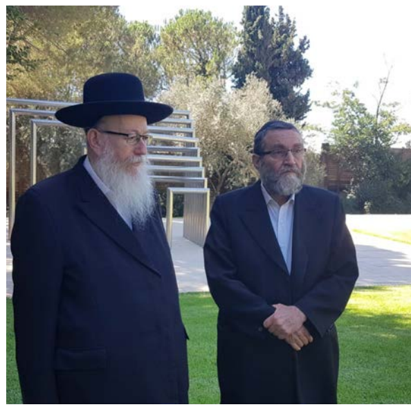
ליצמן וגפני בכניסתם להמליץ על נתניהו בפני הנשיא