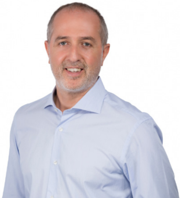
דרור אוהב ציון

עיר נוספת הבולטת בזינוק בהיתרי הבנייה היא אור עקיבא עם היתרי בנייה ל-927 דירות במחצית הראשונה של 2019 לעומת 4 היתרים