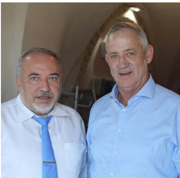
ליברמן וגנץ אחרי פגישה ביפו

שבוע לאחר הבחירות והערפל הפוליטי עדיין לא התבהר • אחרי ששמע את נציגי כל הסיעות, החליט נשיא המדינה ראובן ריבלין לזמן את רה"מ בנימין נתניהו ואת יו"ר כחול לבן בני גנץ לשיחה משולשת, שבמהלכה הותיר את השניים לבדם בחדר • המתווה להקמת ממשלת אחדות עדיין רחוק בשל ההתעקשות של כחול לבן שנתניהו לא יעמוד בראשות הממשלה ובשל התעקשות הליכוד שהממשלה תושבת על הבלוק הפוליטי של מחנה הימין המונה 55 חברי כנסת