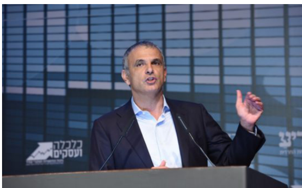
שר האוצר משה כחלון

"אין ספק שלפחות עד סוף השנה, אנחנו הולכים לסיים את