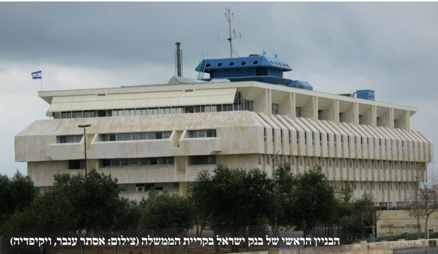
הבניין הראשי של בנק ישראל בקריית הממשלה

נגיד בנק ישראל והמפקחת על הבנקים הודיעו ליזמים, מר מריוס נכט ופרופ' אמנון שעשוע, על נכונות הנגיד להעניק להם רישיון בנק והיתר לשליטה בבנק, זאת לאחר שהפיקוח על הבנקים סיים את תהליך הבדיקה של המיזם להקמת הבנק הדיגיטלי