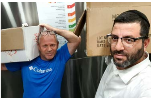
ארגוני התנגדויות בדרך לוועדה

במטה המאבק לכינוי שפוי בסירקין - המוביל את מאבק התושבים בעיר - טוענים כי מדובר בעקירתם של כ- 3,700 עצי אקליפטוסים וותיקים בני למעלה מ-100 שנה.