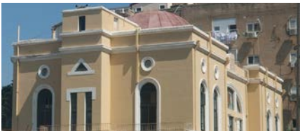
ישיבת לומז'א.

הידיעה על הסרת הצופר עוררה דיונים סוערים בקבוצות תושבים, ורבים מהם – גם שאינם שומרי שבת – הביאו פליאה. "אני חילונית, גרה ליד", כתבה יהודית ששון. "ולא רק שזה לא מפריע לי אני חושבת שזה הרבה יותר נחמד מצפירה שמזכירה מלחמות ואזעקות. אני חושבת שזו יוזמה יפה, די לשנאת החינם".