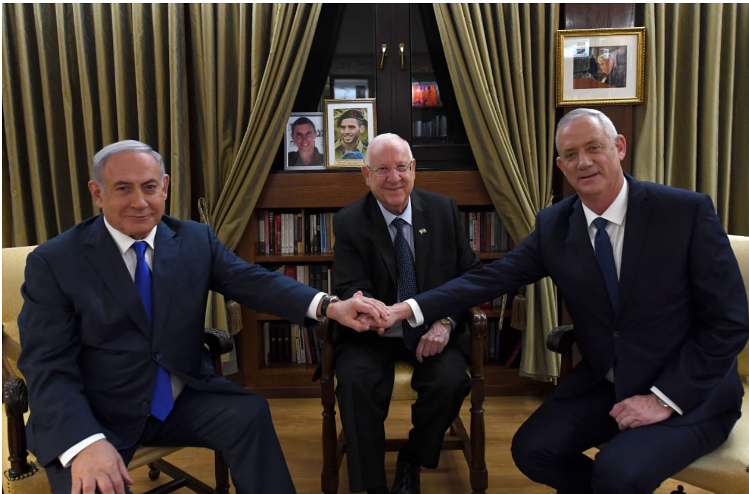
מאפיית אחדות. ריבלין מארח את נתניהו וגנץ

הממשלה. עד שבאה המציאות והוכיחה שבכאוס הפוליטי הישראלי, גם כללי משחק איטלקיים אינם תקפים.