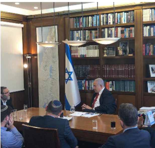
נתניהו וראשי סיעות הימין במעמד הקמת 'הבלוק'