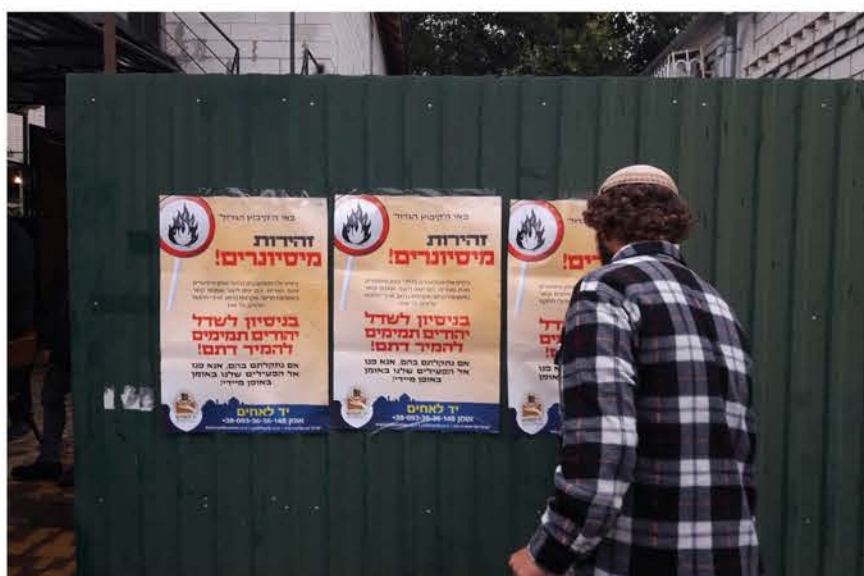
מודעות הרחוב של יד לאחים באומן

אחרי דיווחים על פעילות מיסיונרית מתריסה ומקוממת בקרב המתפללים באומן בראש השנה בשנים האחרונות, יד לאחים יטיס צוות מיוחד לאומן, זו השנה השנייה, כדי להיאבק בתופעה • בשנה שעברה סיכלו הפעילים פעילות מיסיונרית ענפה, וסיכלו הקמת דוכן הטפה מיוחד • ביד לאחים מפצירים: נתקלתם בפעילות מיסיונרית? פנו בדחיפות לנציגינו באומן שמצוידים במספר ישראלי • להעביר גילולים מן הארץ