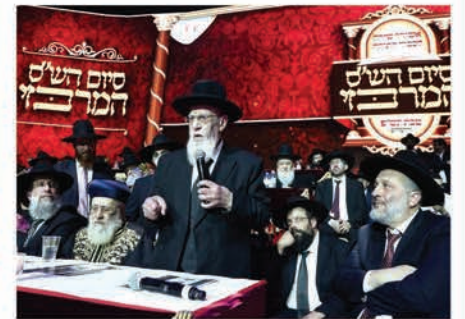
מרן הגר"ש כהן במשא