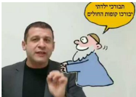
ציורי חרדים משפילים מתוך הסרטון

עכשיו בואו נדבר עובדות: אם תגיעו לקופות חולים, תמצאו מטופלים שנמצאים במחלקות פלסטיות למטרות שהינם לא הצלת חיים כמו להסיר צלקות, גמילה מעישון ועוד. יותר מזה, במצע המפלגתי של 'כחול לבן', יש סעיף שדורש סבסוד לאנשים שרוצים לעשות ניתוחים למטרות שלדעתם יוסיפו יופי חיצוני לגופם. כלומר, לגיטימי מאוד ואף רצוי טיפולים שאינם בגדר הצלת חיים ואף על חשבון המדינה. כל זה, אם זה לא קשור להלכה, אבל בהקשר של הלכה, זאת כבר עילה לסרטון אנטישמי.