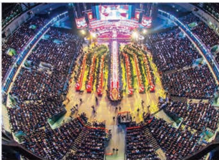
הקהל העצום בהיכל הארנה בירושלים