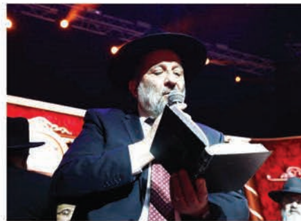
יו"ר ש"ס השר דרעי במעמד הסיום