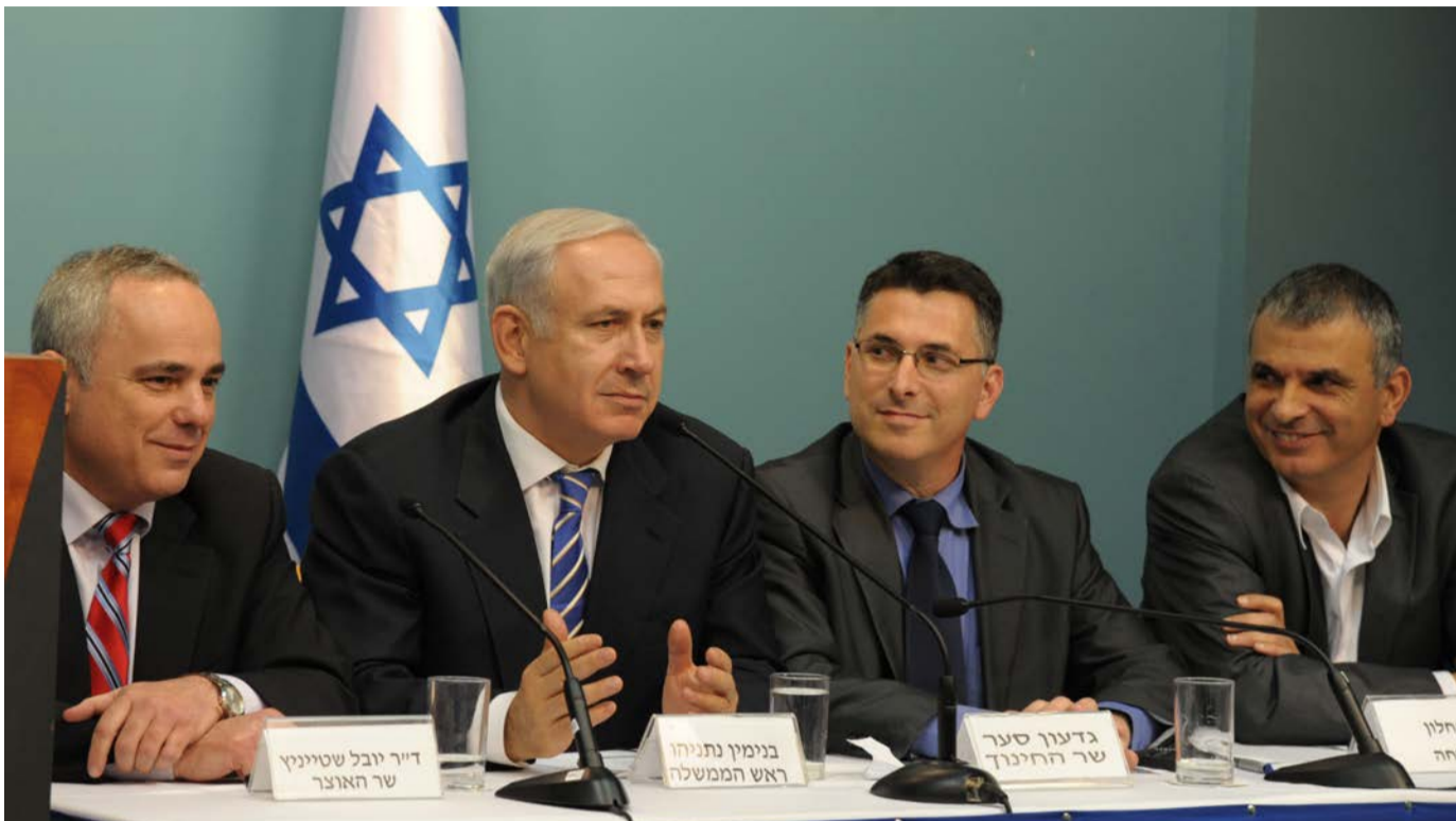
ישלבו ידעם בקמפיין? רוח"מ נתניהו ויריבו-יורשו גדעון סער