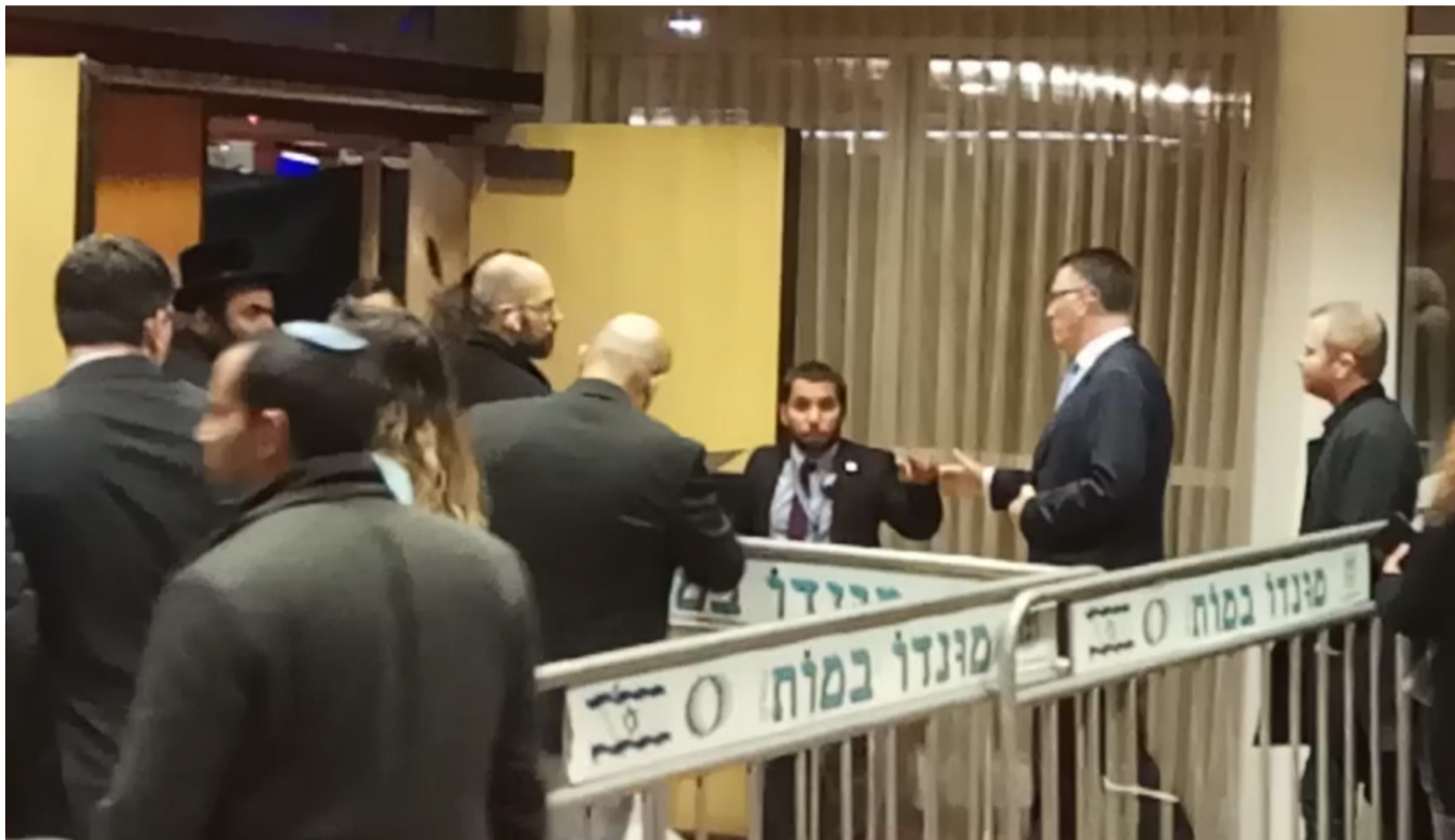
סער נכנס לאירוע הליכוד

"האוכל פה כשר", אומרת לי פעילת הליכוד, אגב נגיסת עוגת שוקולד. "מה נראה לך, אנחנו כחול לבן? שם היו נותנים לך חזיר", וזו הייתה קבלת הפנים באירוע חגיגי שכינס ראש הממשלה בנימין נתניהו, ליל 'זאת חנוכה', מלון דן פנורמה, תל אביב. לנתניהו יש סיבה טובה לחגוג – רק לפני ימים הביס את יריבו גדעון סער וקיבל תמיכה גורפת של חברי מפלגתו, ויש סיבות לדאגה – חסינות, בג"צ, כתבי אישום ומערכת בחירות לא קלה. בנאום ארוך ומשעשע, לא ניכר שמץ של חולשה. כשהוא בשיא כושרו הרטורי, ליהטט נתניהו בין מצגות, גרפים, קטעי וידאו והומור, כאשר גולת הכותרת – נתניהו מכין את הציבור לקראת בקשת חסינות מהכנסת.