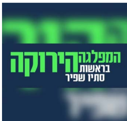
מפלגות נולדות. הלוגואים החדשים של המפלגה הירוקה ושל הבית היהודי המאוחד

ראשי 'כחול לבן' מבינים את חשיבות המפלגות הקטנות שמשמאלם, ועל פי פרסומים, הציעו לשרייץ ברשימתם את אורלי לוי-אבקסיס – שותפתו של פרץ להנהגת העבודה-גשר ואשת ימין – בתמורה לאיחוד של פרץ עם מר"צ. ב'כחול לבן', הכחישו את הפרסום ואמרו: "לא היה ולא נברא". ובגזרת מר"צ, נראה שהצדדים משלימים עם