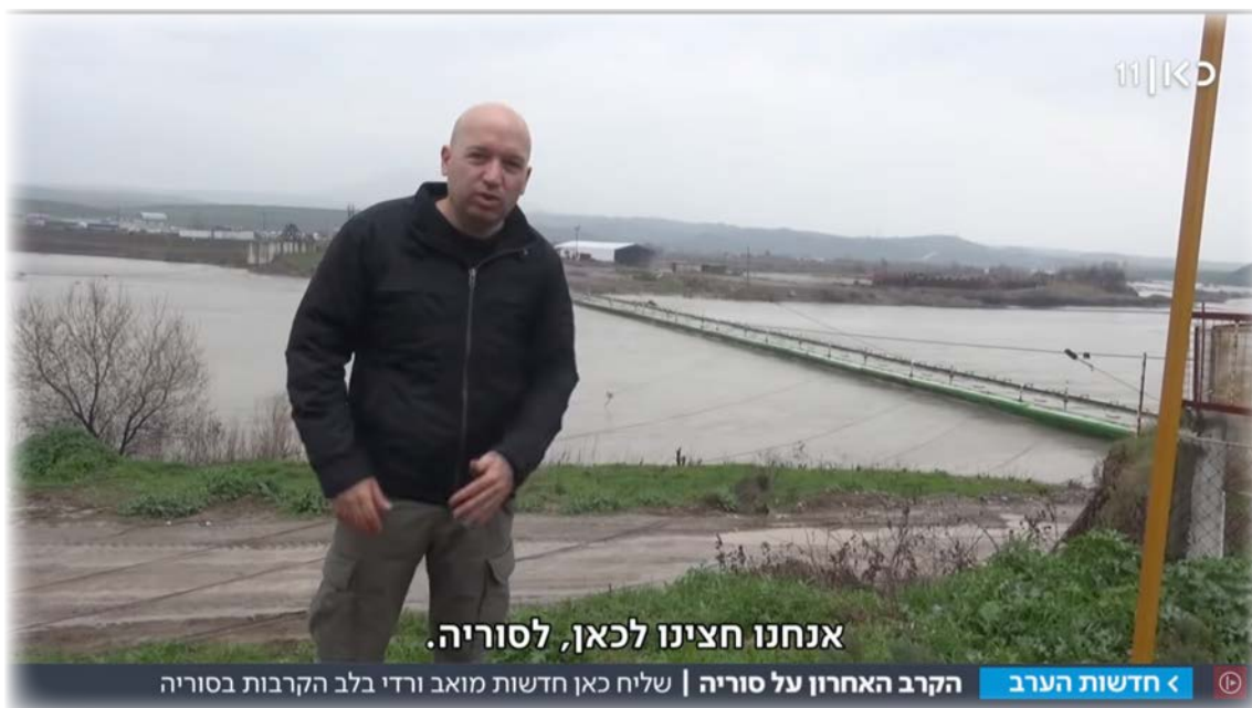
אנחנו חצינו לכאן, לסוריה.

“לא הרבה. הם עדיין נלחמים, גם מול כוחות אסאד וגם מול כוחות דאעש שמתעוררים, וגם מול טורקיה. לא יהיה לזה סוף עד שבעצם תגמר מלחמת האזרחים בסוריה מבחינה מדינית, ואז נראה את מצבם, אם הם יקבלו אוטונומיה. כרגע המצב שם הוא אותו דבר. למרות שהם הביסו את דאעש, הוא מתחיל לחזור פה ושם בכל מיני מקומות בשטח. ובמיוחד הם ניצבים מול ארדואן שרואה בהם טרוריסטים, והם במאבק שלא נגמר. אני חושב שהוא יגמר רק כאשר בסוריה יגיע המצב לאיזשהו פתרון או הסדר מדיני”.