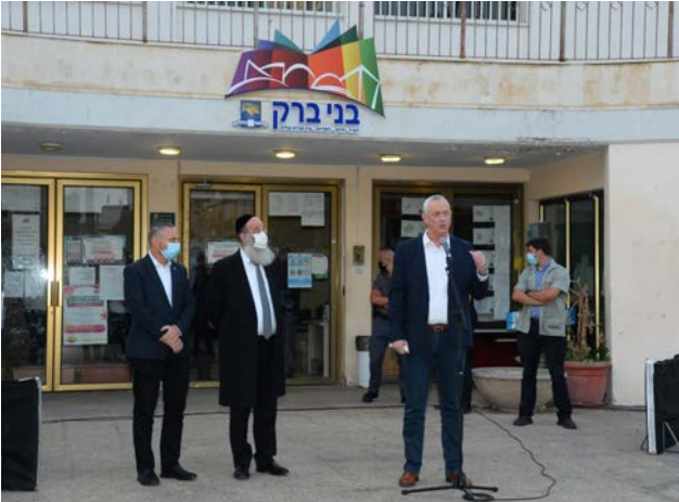
שר הביטחון בסיוע בעיריית בני ברק

"בהתחלה אפילו מי שרצה להתפנות למלונית היה צריך להתמודד בסבך ביורוקרטי בלתי אפשרי, היית צריך לדרוף אחרי קופת החולים ושם היו אומרים בכלל שתישאר בבית... הקמנו פה חמ"ל ייעודי והבאנו נציגים של כל קופות החולים, של מד"א,