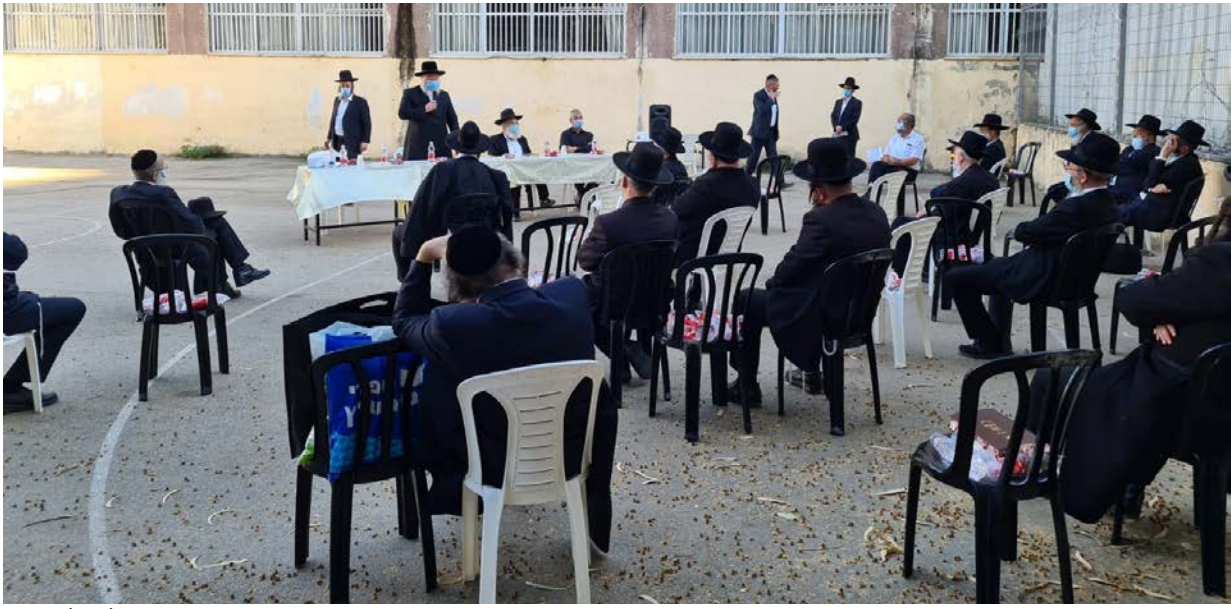
תדרוך מיוחד למנהלי מוסדות