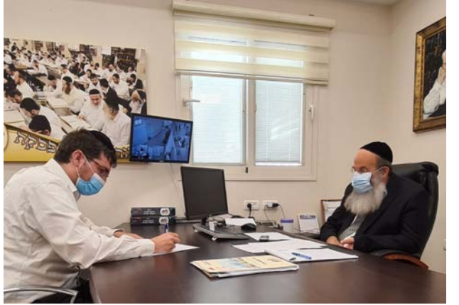
ראש העיר בראיון