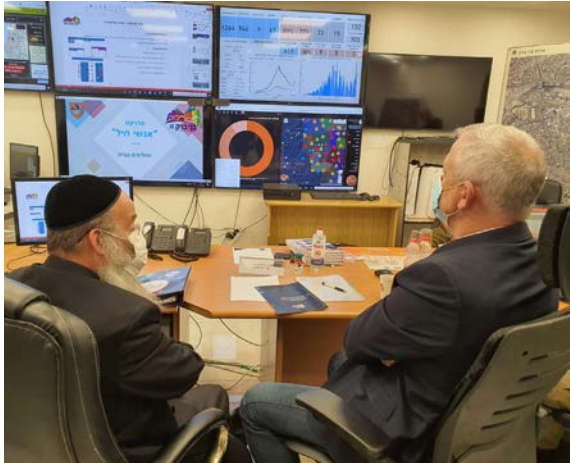
שר הביטחון בחמל המיוחד