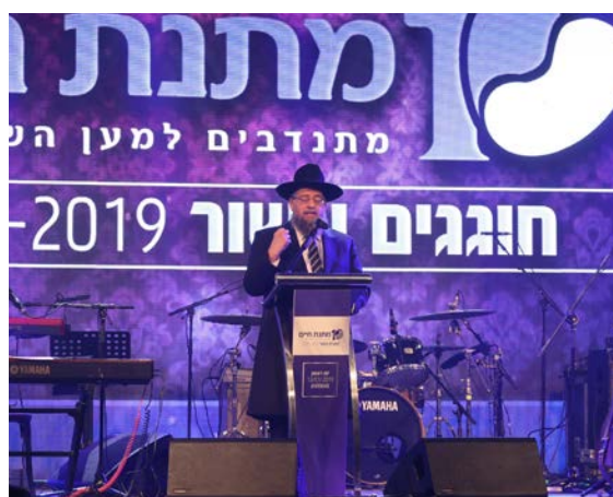
הרב הבר זצ"ל נואם בטקס העשור

הרב לא הסתפק בכך, הוא שאף להגיע להרבה יותר ותמיד היה אומר: "אל תסתכל על המקום בו אתה נמצא עכשיו, תסתכל עשר שנים קדימה ויותר". את המשפט הזה הוא אמר לעצמו, לחבריו לדרך, וגם לחולים שהוא עודד בדיאליזה ולבכורים שעזר להם בשיבה. הוא תמיד המליץ לא להביט על הקשיים הנקודתיים שיש בחיים אלא להאמין שבעתיד יבואו ימים טובים יותר, ושבהסתכלות למרחקים, הקשיים העכשוויים מתגמדים ותופסים את הפרופורציות הנכונות