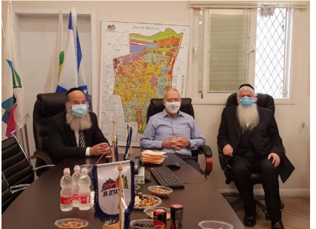
שר החינוך וסגנו בעיריית בני ברק