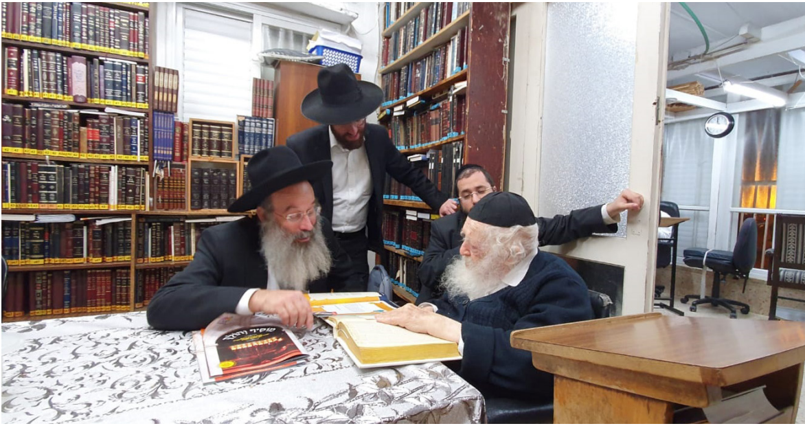
עם מרן שר התורה הגר"ח קנייבסקי

שכולנו יחד כמו ספינה בלב ים, ואסור לאפשר שאף אחד יקדח חור בספינה הזו. כל אחד צריך לדעת לכבד ולהבין את השני."