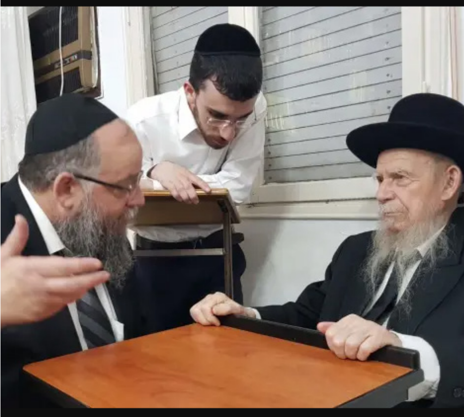
הרב הבר זצ"ל עם מרן הגר"ג אדלשטיין.