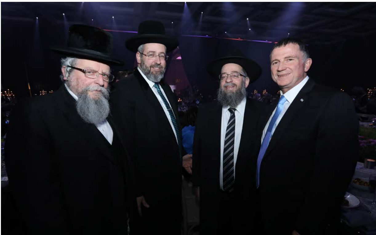
הרב הבר זצ"ל בטקס העשור עם הרה"ר הגר"ד לאו, השר יולי אדלשטיין (כיו"ר הכנסת) והרב אלימלך פירר