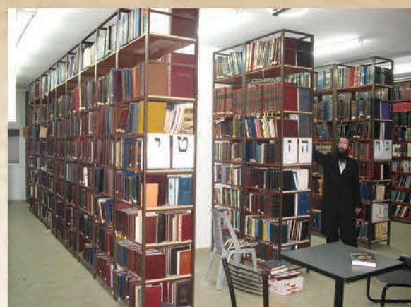
הרב איילנברג באולם הארכיון העצום שהותיר חמיו הרב מורגשטון