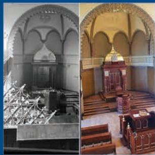
שחזור בית הכנסת קרליבך