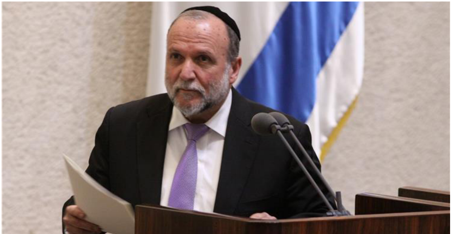
המנצח הבלתי צפוי, השר במשרד האוצר ושר השיכון איציק כהן