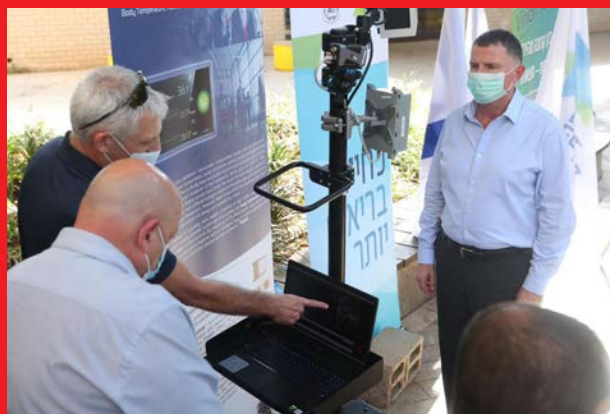
שר הבריאות בבדיקת טכנולוגיות רפואיות נגד הקורונה