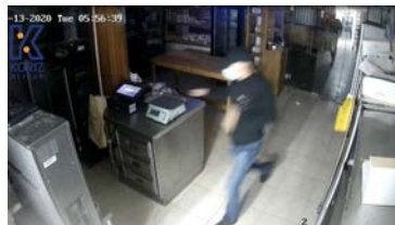
אחד הפורצים נפי שנתעד במצלמות האבטחה

אחרי גל הפריצות שהתרחש בחול המועד למספר עסקים בבני ברק ובהם ספרי אור החיים, מאפיית הצבי וצרוור המור, ביום שני בלילה התרחש גל נוסף של פריצות לעסקים נוספים ובהם קונדיטוריה כץ, היימיש פון ועוד