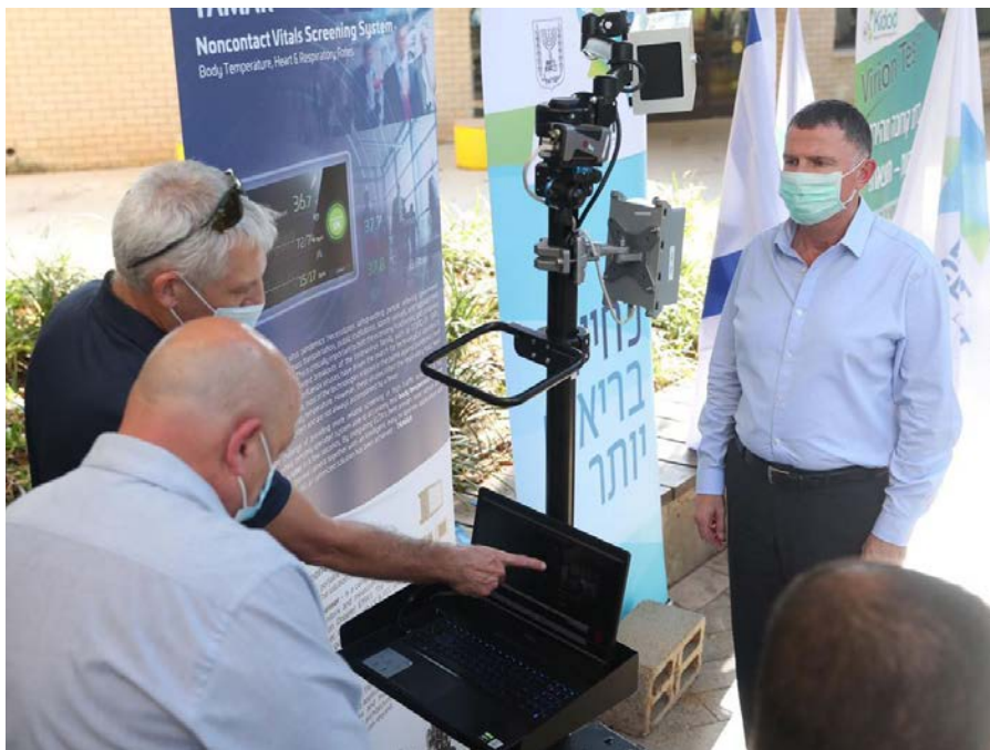
שר הבריאות יולי אדלשטיין בבדיקת טכנולוגיות רפואיות נגד הקורונה

במשרד הבריאות מבקשים להפריך את המיתוס שהיה נפוץ בתחילת הקורונה בחודשי מרץ-אפריל ולפיו מספר המתים משפעת גבוה יותר ממספר המתים מקורונה. ובכן, הנתון הזה לחלוטין אינו נכון.