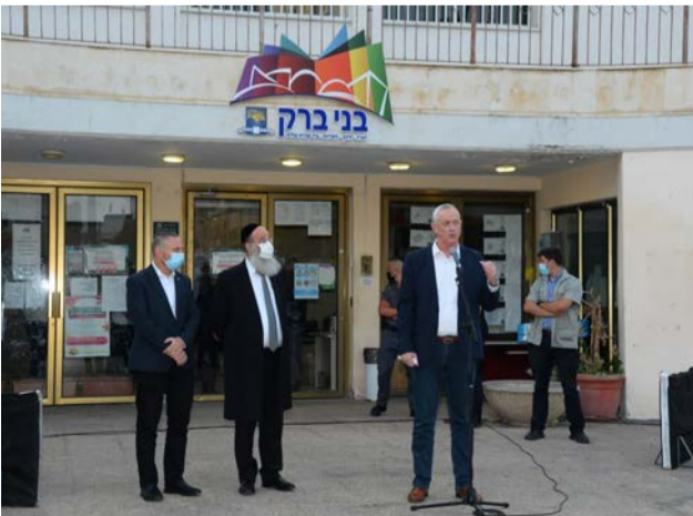
שר הביטחון בסיוור בעיריית בני ברק

"כל מדינת ישראל ראתה שקיבלנו את החיילים בבין אדם לחברו, בהתנהגות ראויה ומכבדת. הרבה מהם הגיעו ממקומות שהם לא ראו קודם לכן צורת חרדי וכאן הם גילו ונחשפו לעולם אחר וחדש עבורם. יוצא לי להופיע עם רוני נומה בתקופה האחרונה בהרבה הקשרים שנוגעים לקירוב ואחדות לבבות, ובכולם שואלים אותי את השאלה הזו ואני עונה שלא קרה כלום. לא יהיה אף בחור ישיבה שילך לצבא בגלל זה כמו שלא יהיה אף חייל שיחזור בתשובה בגלל זה... אבל כולם יודעים עכשיו