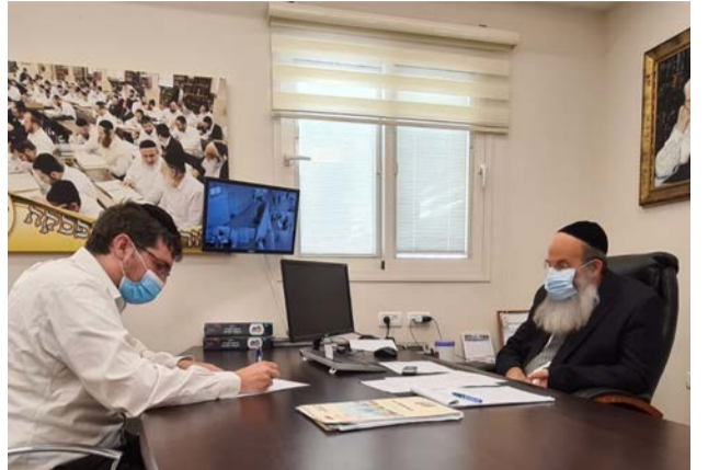
ראש העיר בראיין

ואם בבניה עסקינן, ראש העיר לא מתמקד רק במגדלים, "יש שם גם פרויקט של כאלפיים יחידות דיור נוספות לעיר, שיקלו במעט את מצוקת הדיור החריפה, חלקן גם במסגרת זולה ונוחה