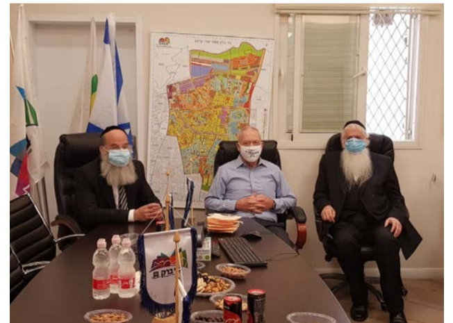
שר החינוך וסגנו בעיריית בני ברק