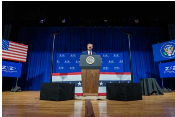
השיג כמה תמונות ניצחון. נשיא ארה"ב דונלד טראמפ

צבוע למדי מצדו של ניסנקורן, מי שניצב כחומה בצורה בתוך הממשלה בעד הזכות להפגין ולהידבק, להאשים את המגזר החרדי בחוסר אחריות. מה גם שאותו 'חופש הביטוי' שעומד להם למפגיני בלפור אמור לעמוד גם למבקריו של השר ניסנקורן. וכי יש איפה ואיפה בזכות הביקורת על פוליטיקאים? אדוני השר, הציבור החרדי סיים להיות שטיח למרמס של כל מיני פוליטיקאים כושלים. לא נסתפק בהתנצלויות רופסות ובסיפורי 'דבריי הוצאו מהקשרם'. מי שמשמין ציבור שלם, מי שמתייג אותנו כמפציץ מחלות ומי שמפנה אלינו את האצבע המאשימה במקום לקחת אחריות על פעילותו האישית – יידרש להתנצל בפומבי, באותה במה ובאותו היקף בו נעשתה ההשמצה. ולא, אך מתבקש לקרוא לפוליטיקאים החרדים להציב אולטימטום חד צדדי בפני ראשי הממשלה, האותנטי והחלופי, או אנחנו או הוא.