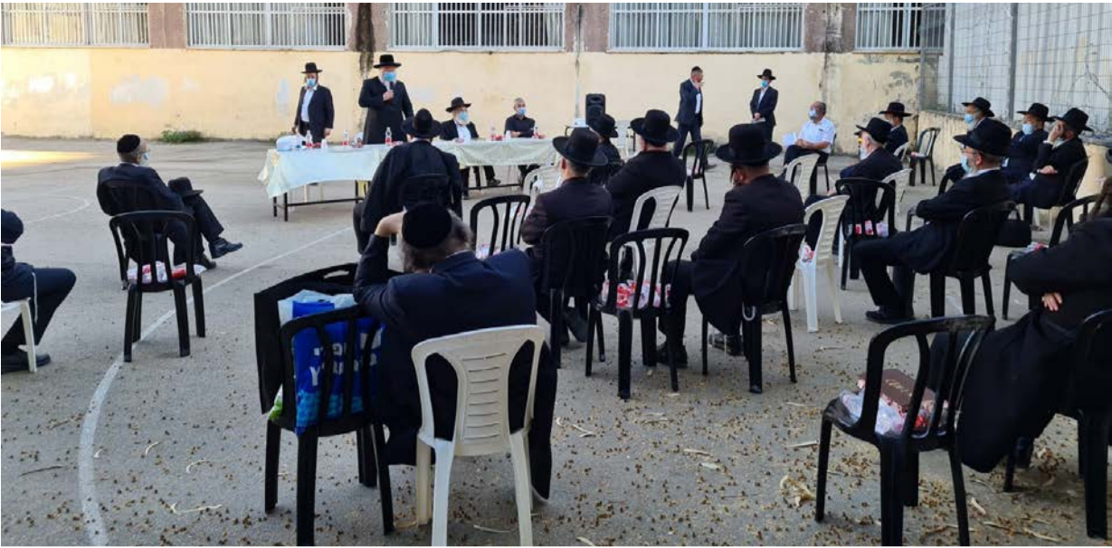
תדרוך מיוחד למנהלי מוסדות

יותר של 'מחיר למשתכן'. מלבד זאת, אנחנו יוזמים את הקמת הברכה הראשונה בעיר, כשרה ומהודרת ובחלוקה לימים נפרדים, אין שום סיבה שתושבי בני ברק יצטרכו לרעות בשדות זרים ולחפש פתרונות בערים שכנות".