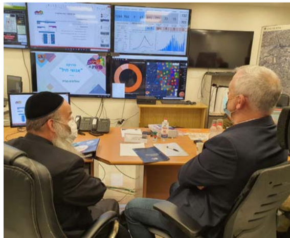
שר הביטחון בחמל המיוחד