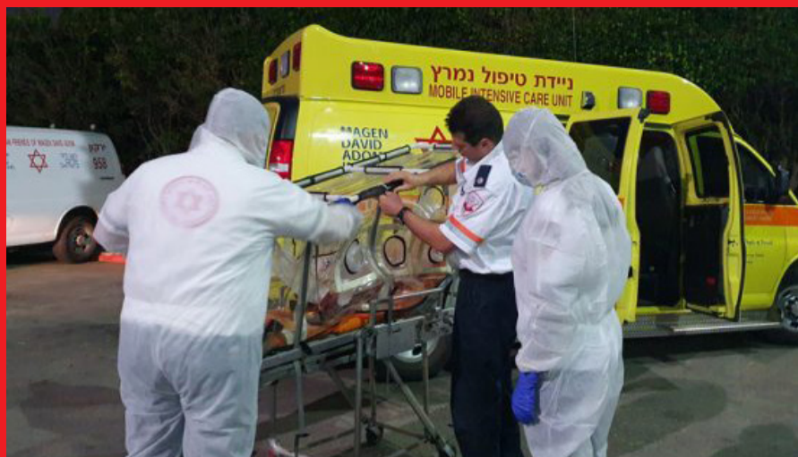
אמבולנס ממזמן מפני הקורונה

ב-1,500 חולים קשים בקורונה החל מה-1 באוקטובר. 2. קביעת היעדים ליציאה מודרגת מהסגר לשגרת קורונה. דיון ביעדים ובמדדים להערכת המצב ולבחינת המדיניות הנדרשת. 3. עדכון תמונת מצב ההצטיידות בחיסונים. 4. תמונת המצב של רכישה ושימוש מערך בדיקות מהירות. 5. מיקוד ההסברה בחובת חבישת מסכות וכללי הריחוק החברתי. 6. דיון ביכולות ובכלים הדיגיטליים למאבק בקורונה. 7. הגדלת יכולות האכיפה, קנסות מוגדלים וסנקציות על הפרת התקנות. 8. תכנית משולבת להכנת מערכת החינוך להפעלה בצל הקורונה. 9. דיון בתכנית ההגנה והסיוע לאוכלוסיית הקשישים.