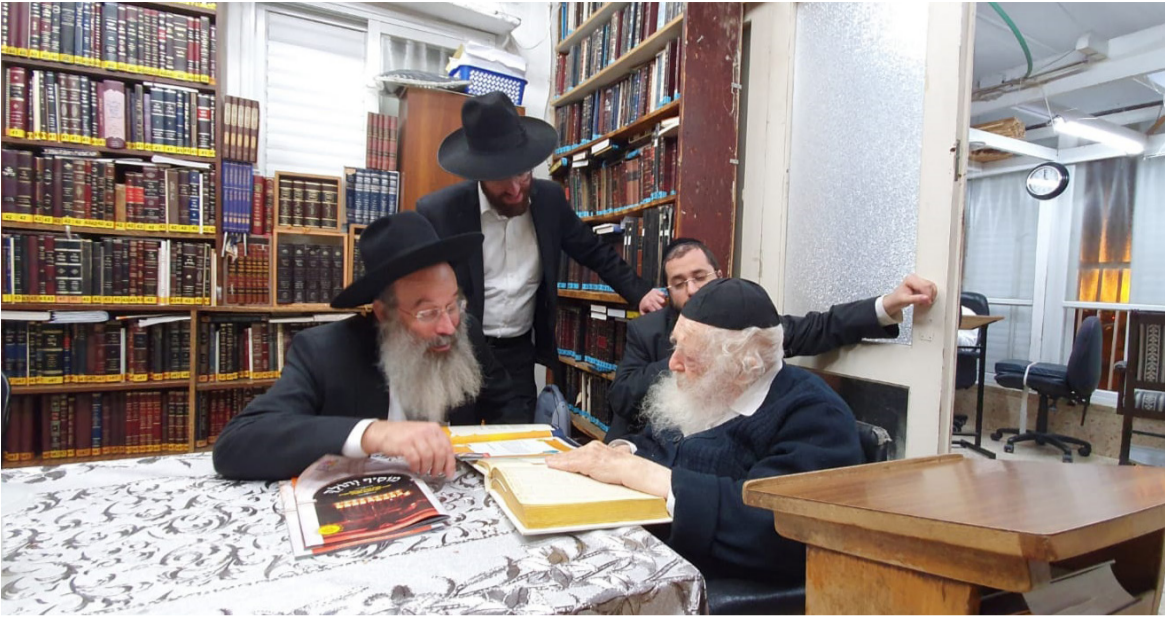
עם מרן שר התורה הגר"ח קניבסקי

"בהתחלה אפילו מי שרצה להתפנות למלונית היה צריך להתמודד בסבך ביורוקרטי בלתי אפשרי, היית צריך לרדוף אחרי קופת החולים ושם היו אומרים בכלל שתישאר בבית... הקמנו פה חמ"ל ייעודי והבאנו נציגים של כל קופות החולים, של מד"א,